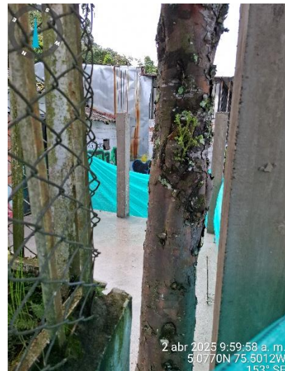
Fotografía 1 y 2: Vista de las actividades de ampliación reportadas en la parte posterior del inmueble CALLE 45C 8 30. En la imagen derecha se observa a detalle las columnas de concreto reforzado y la placa de contrapiso de concreto.