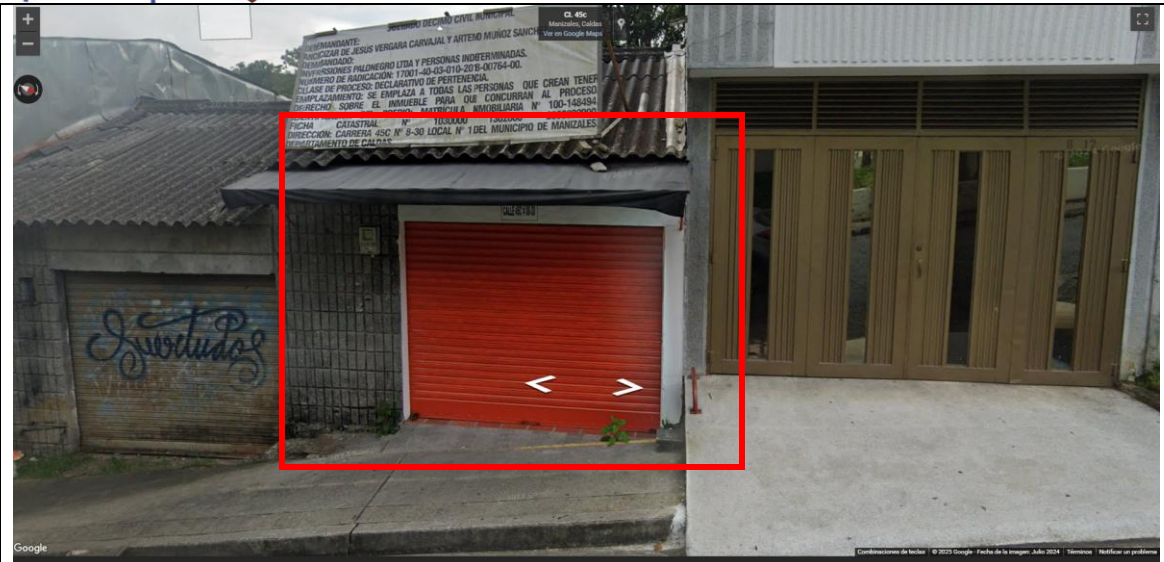
Imagen No. 2. Registro visual JULIO DE 2024 Inmueble de la CALLE 45C 8 30 - Barrio Altos de Capri, Comuna Ciudadela del Norte.