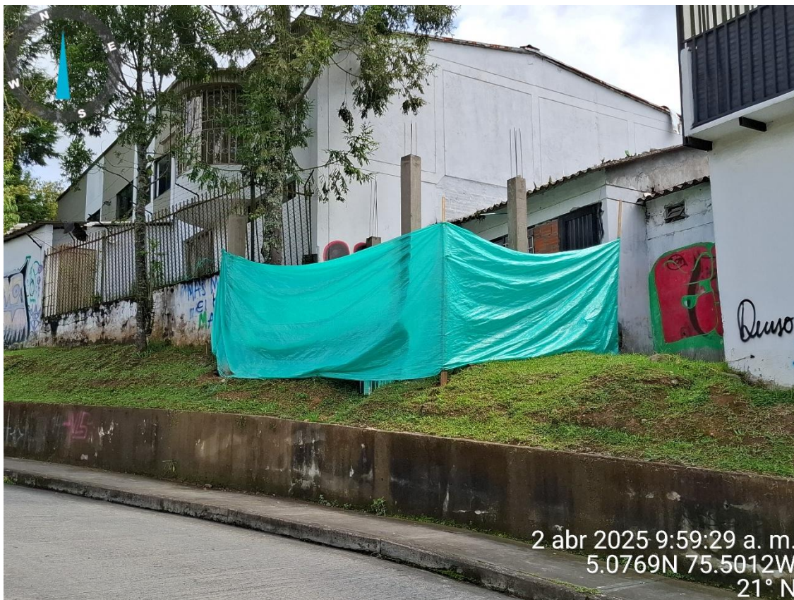
Fotografía 3: Vista general de las actividades de ampliación reportadas en la parte posterior del inmueble CALLE 45C 8 30..