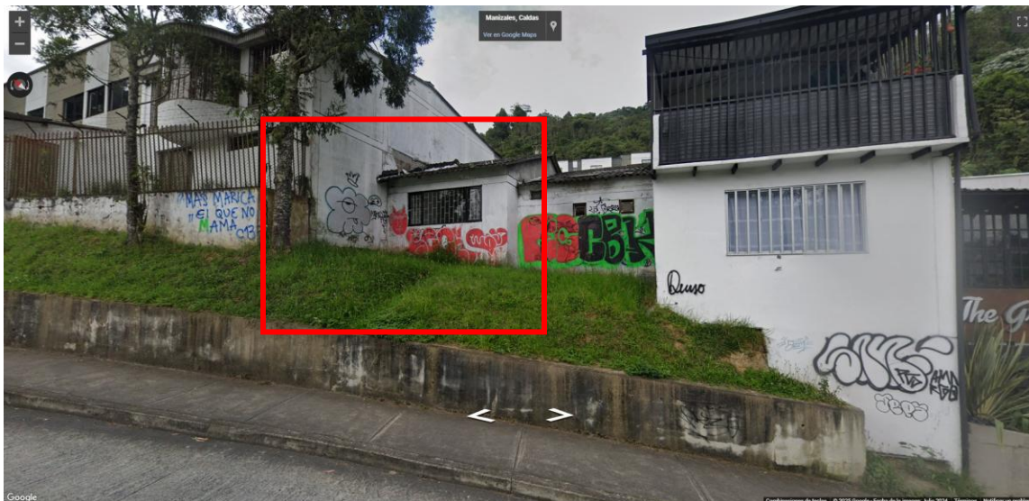
Imagen No. 3. Registro visual JULIO DE 2024 Parte posterior a la CALLE 45C 8 30 - Barrio Altos de Capri, Comuna Ciudadela del Norte.