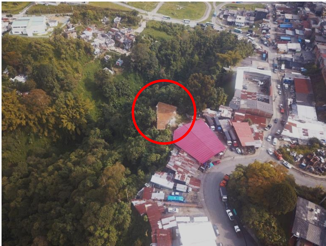
Fotografía 1 Intervención constructiva parte posterior de los talleres de mecánica (En rojo)