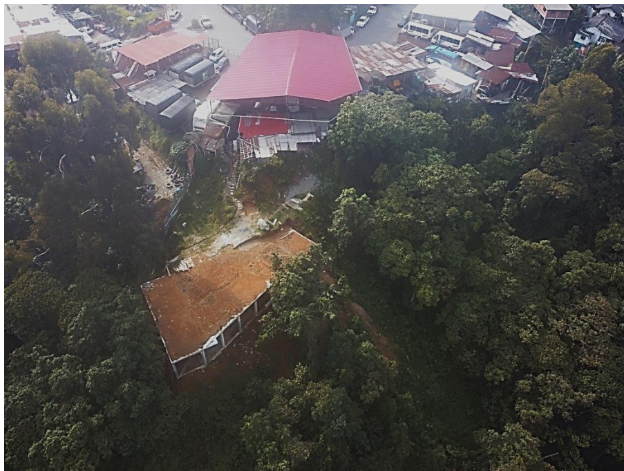
Fotografía 3 Construcción de estructura en pórticos en concreto