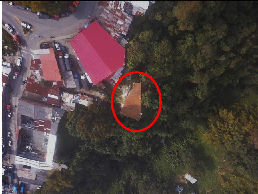
Fotografía 2 Intervención constructiva parte posterior de los talleres de mecánica (En rojo) Capturas propias