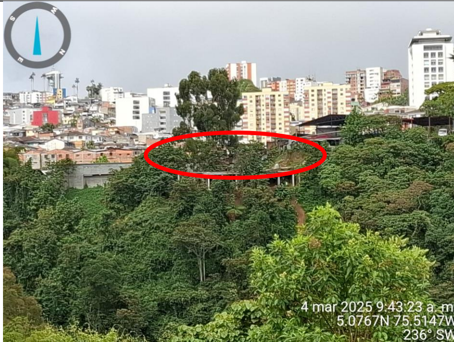
Fotografía 4 Construcción de estructura en pórticos en concreto Capturas propias