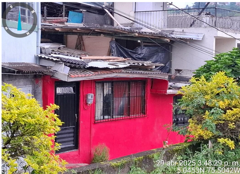
Imagen No. 3 – Fotografía del predio en el mes de abril del 2025.