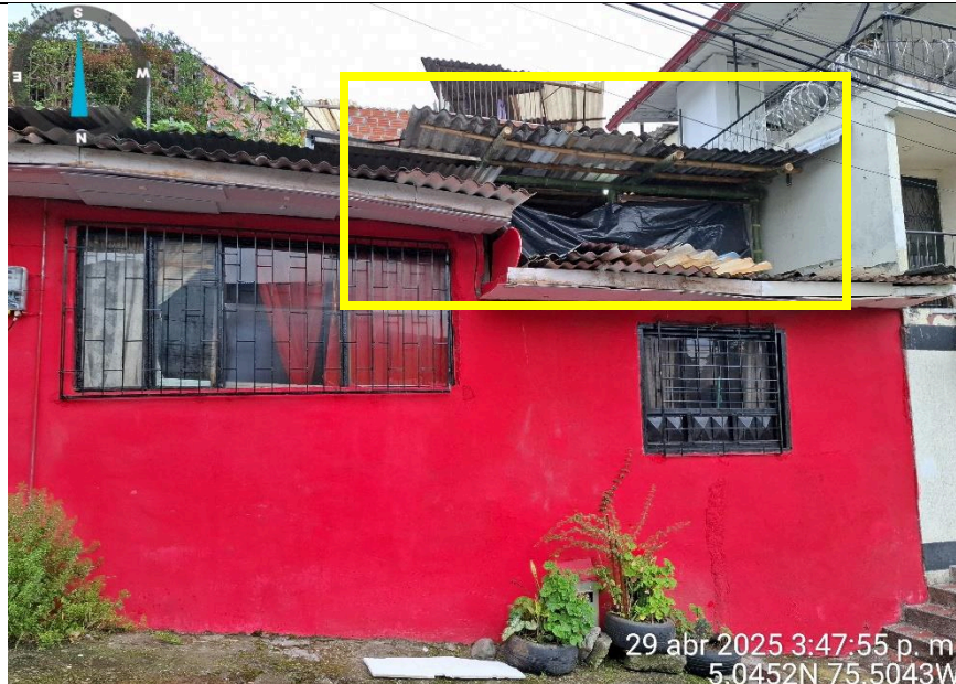
Imagen No. 4 – Construcción de terraza, Calle 67D 42A-37.