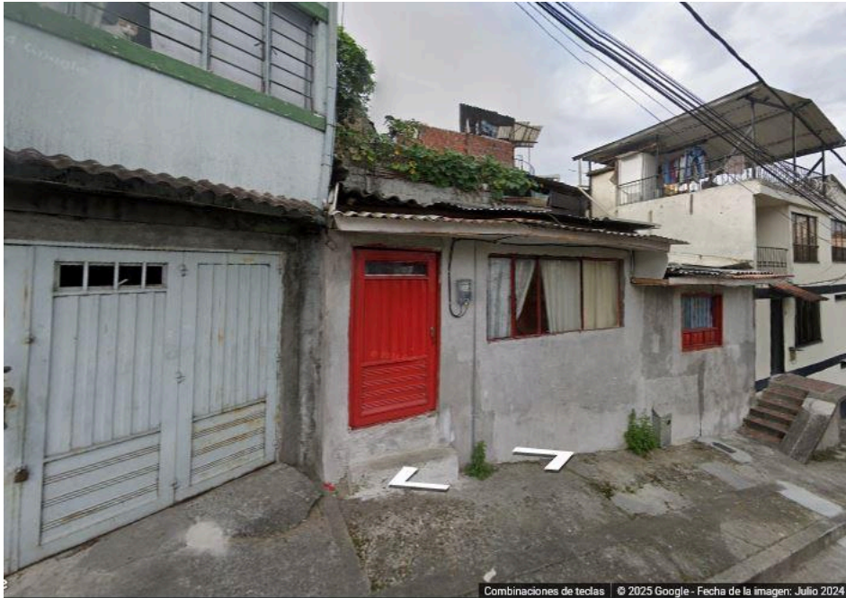
Imagen No. 2 – Fotografía del predio en el mes de julio del 2024.