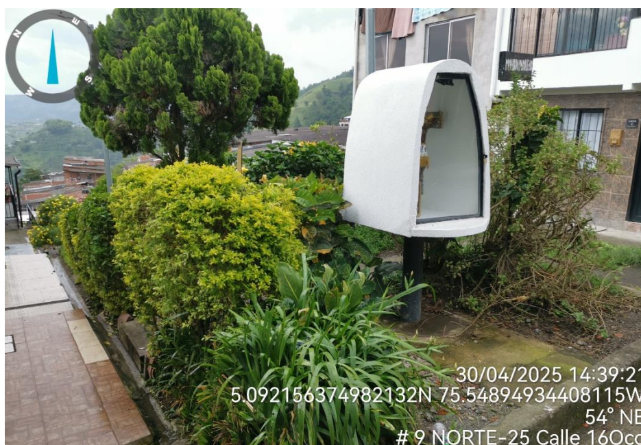
Imagen No. 1 – Estado actual de la zona verde.

Se anexa evidencia fotográfica de la visita realizada y el informe técnico SINT VC 1272-2024.