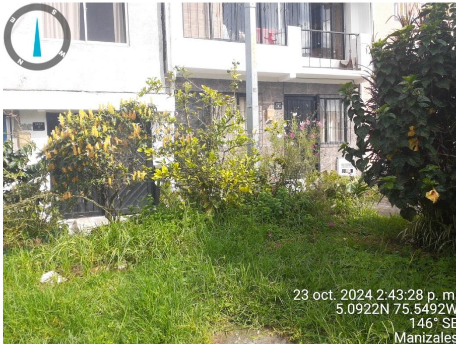
Fotografía 2 Predio objeto de consulta Zona Verde Calle 16Occ 9N 30