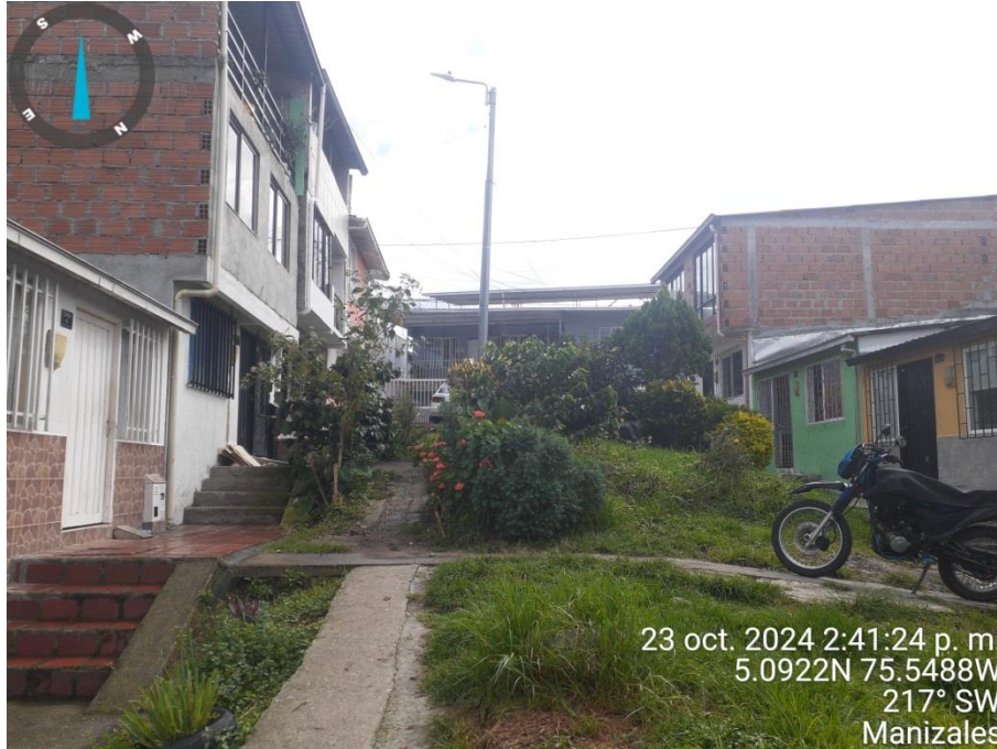
Fotografía 1 Predio objeto de consulta Zona Verde Calle 16Occ 9N 30 Capturas propias