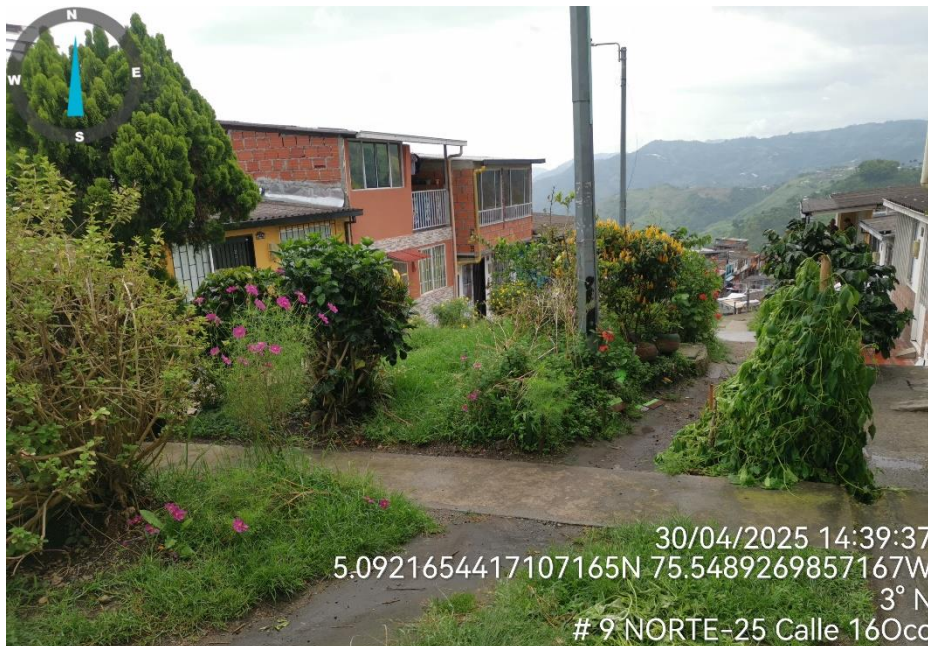
Imagen No. 2 – Estado actual de la zona verde.