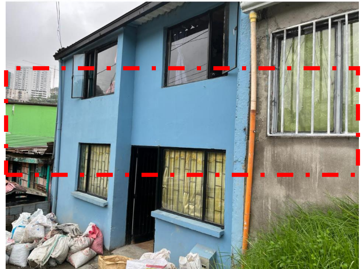
IMAGEN No 4. Evidencia de la ocupación irregular sobre el espacio público por materiales de construcción.