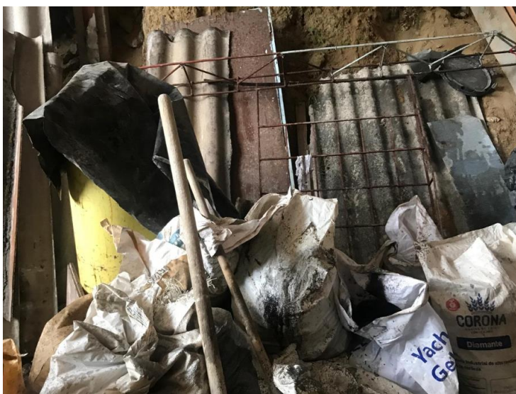
IMAGEN No 7. Materiales de construcción al interior del inmueble.