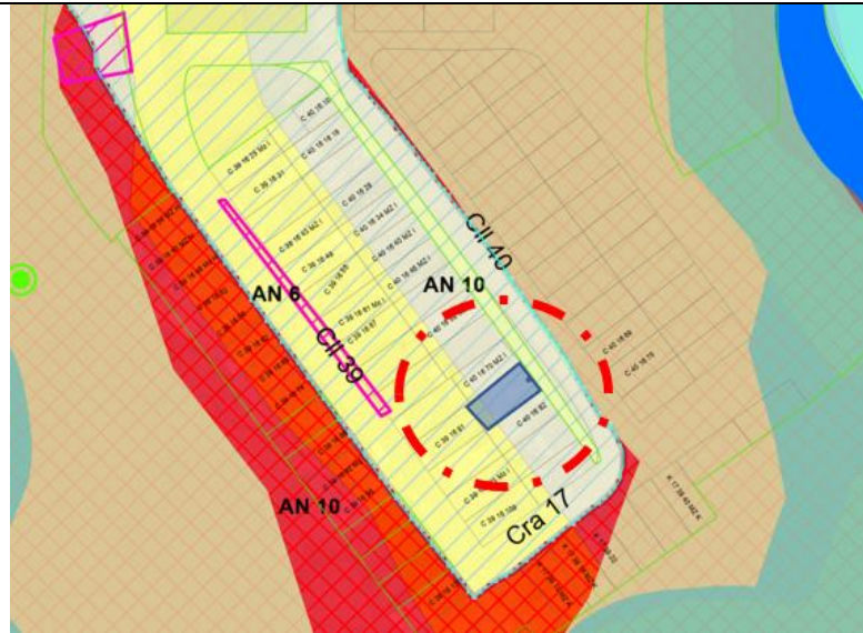
IMAGEN No 2 CARTOGRÁFICA. Barrio Villa Julia, Comuna Ciudadela del Norte

EQUIPO TÉCNICO DE VIGILANCIA Y CONTROL URBANÍSTICO