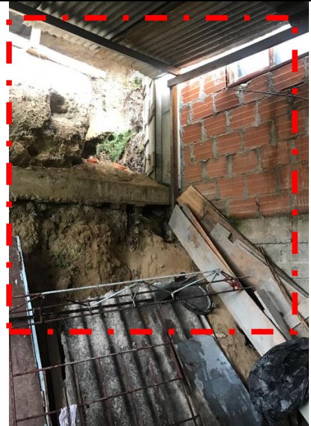
IMAGEN No 6. Ocupación tota sobre el patio, sin dar lugar a la iluminación natural.