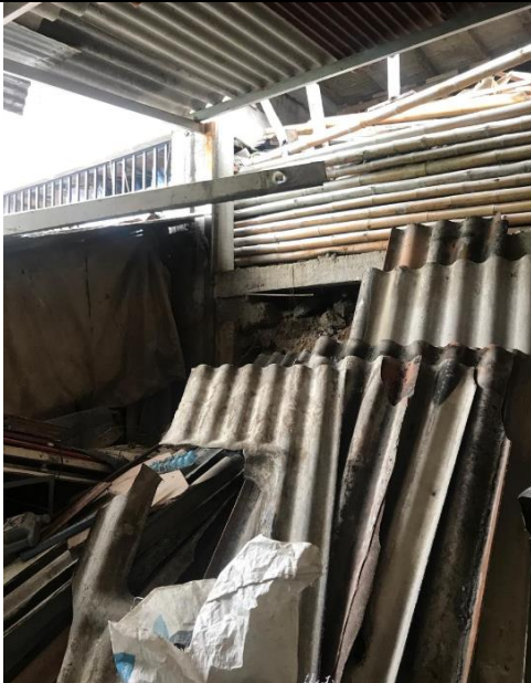
IMAGEN No 5. Descarga del techo sobre las columnas del predio colindante.

EQUIPO TÉCNICO DE VIGILANCIA Y CONTROL URBANÍSTICO