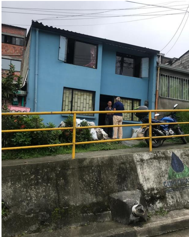
IMAGEN No 3. Fachada principal del inmueble.