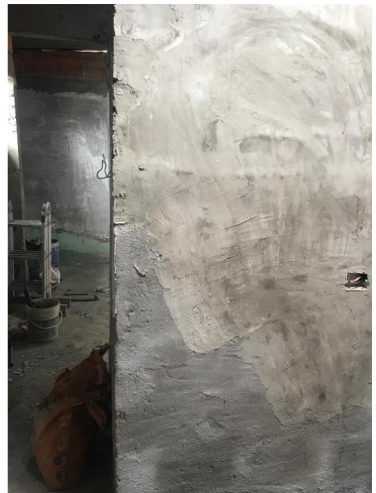
IMAGEN No 8. Levantamiento de muros divisorios confinados.