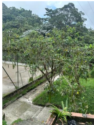
Imagen 1. Individuo a intervenir

De acuerdo a inspección ocular se evidencian: