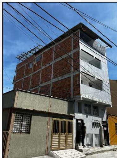
Foto No. 4 Fachada lateral izquierda.