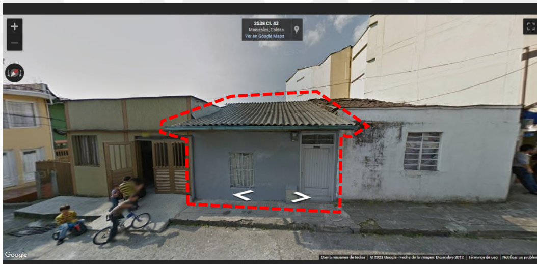
IMAGEN No 2. Imagen tomada por Google Street View, diciembre de 2012.