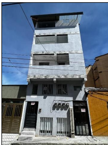
Foto No. 1 Fachada principal del inmueble ubicado en la dirección en campo: Calle 44 24-80, al realizar la consulta en el SIG – según Masora la dirección es: Calle 44 25-32.