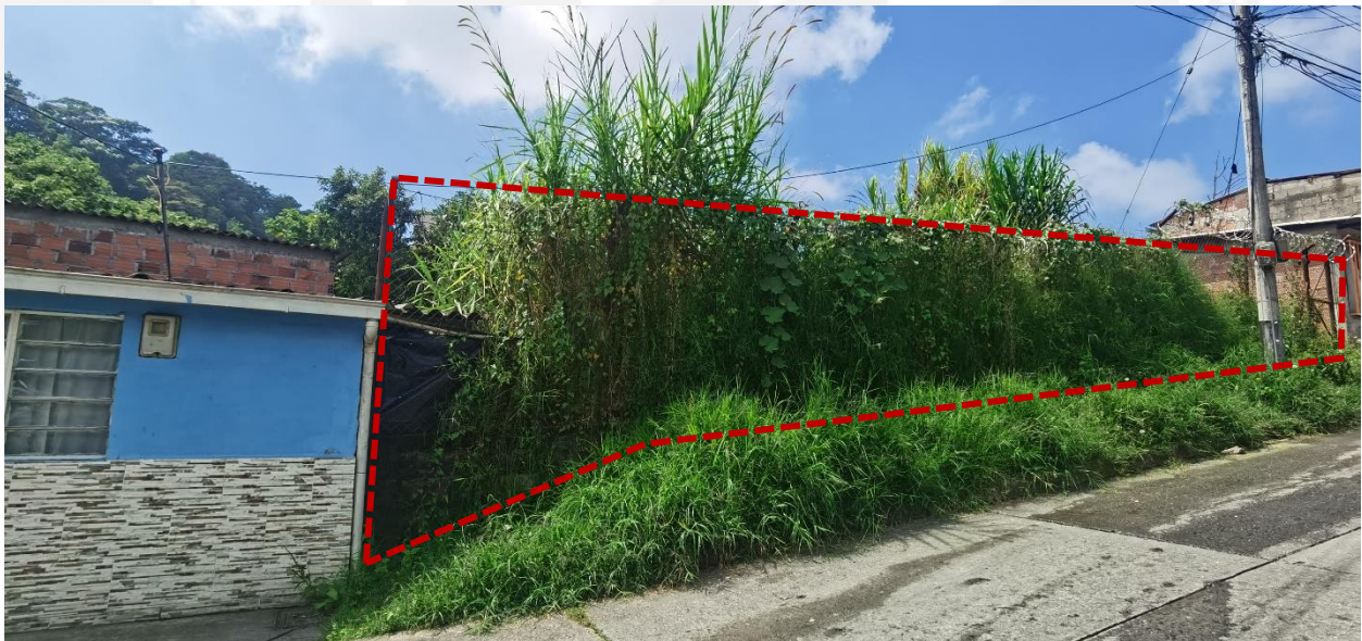
Fotografía No. 1. Registro fotográfico 16/11/2023