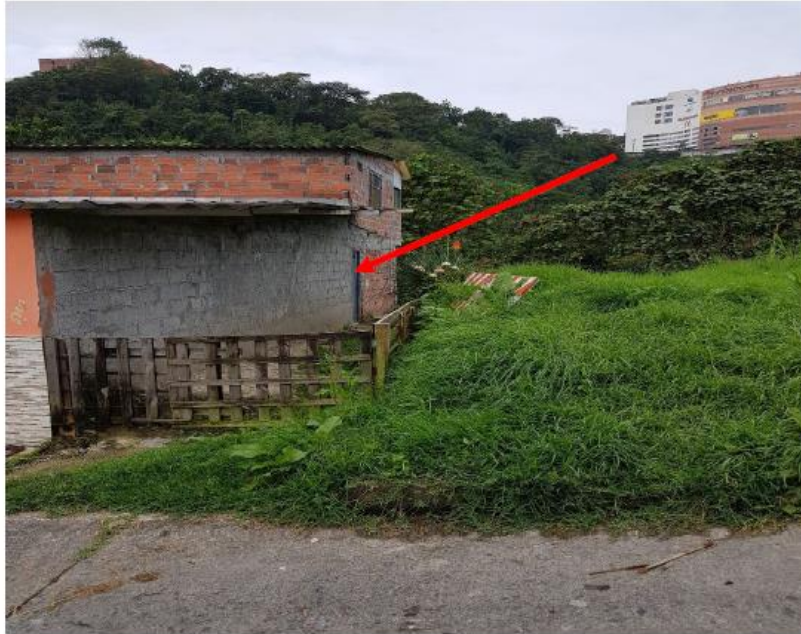
Foto No. 1 Acceso utilizado por la vivienda ubicada en la calle 39 No 16-120, a través de un lote del municipio de

Fotografía No. 1. Registro fotográfico 28/03/2019. SGM VC 0386-2019 del 29 de marzo de 2029.