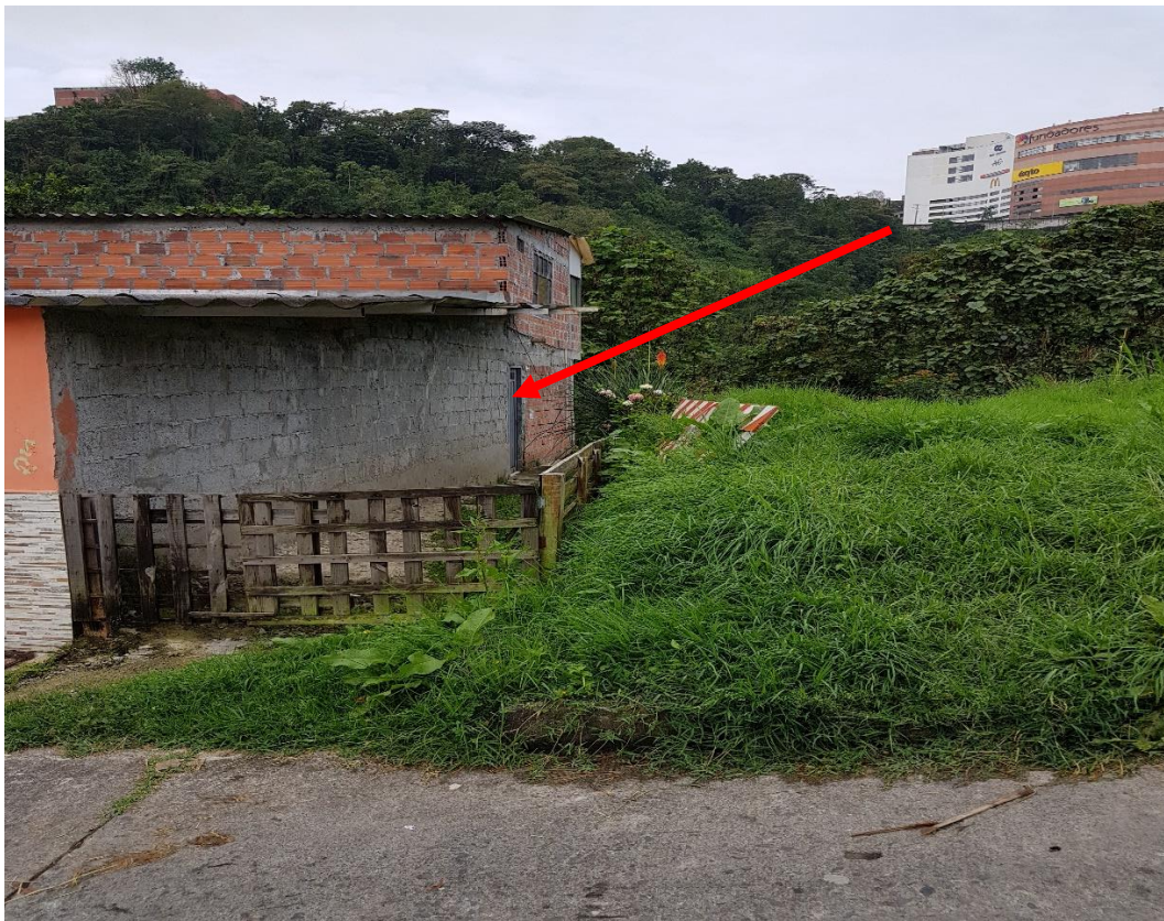
Foto No. 1 Acceso utilizado por la vivienda ubicada en la calle 39 No 16-120, a través de un lote del municipio de