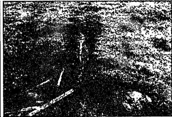
Imagen 3: Descole pozo séptico