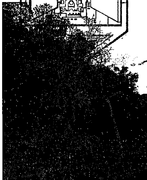
Imagen 1. Individuos a intervenir

ALCALDÍA DE MANIZALES Calle 19 N° 21-44 Propiedad Horizontal CAM Teléfono 892 80 00 – Código postal 170001 – Atención al Cliente 018000 9689888 www.manizales.gov.co