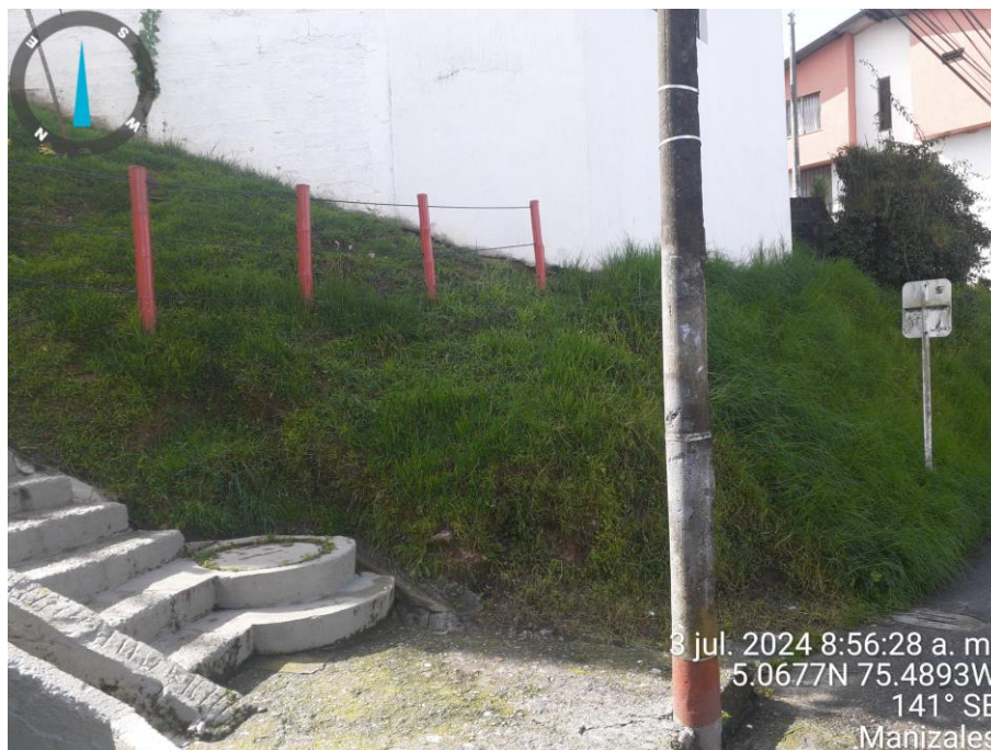
Imagen No. 4 – Evidencia fotográfica tomada por el equipo de Control Urbanístico – 03 de julio 2024.