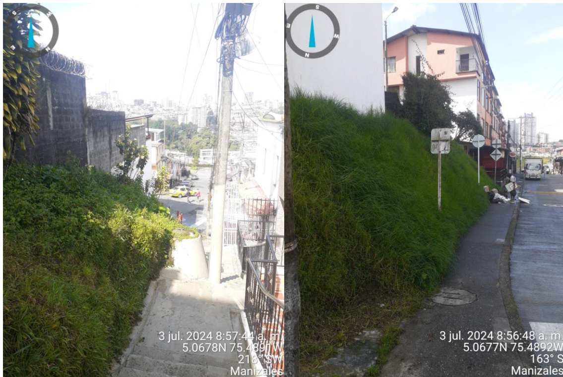
Imágenes No. 2 y No. 3 – Evidencia fotográfica tomada por el equipo de Control Urbanístico – 03 de julio 2024