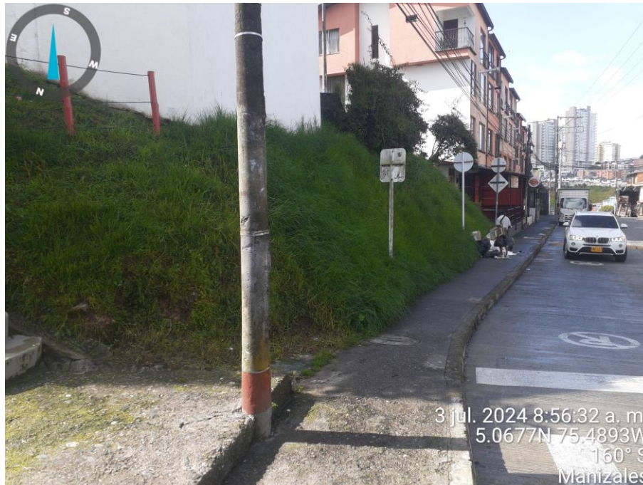
Imagen No. 5 – Evidencia fotográfica tomada por el equipo de Control Urbanístico – 03 de julio 2024.