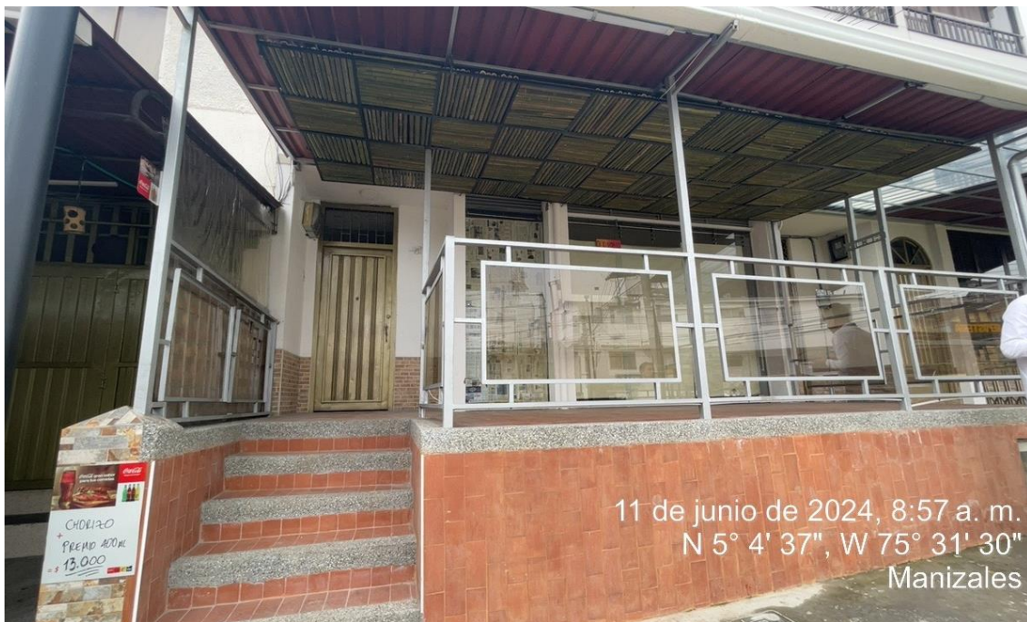
Imagen No. 4 – Evidencia fotográfica de cerramiento y cubierta en antejardín Calle 10 No. 08-15, barrio Chipre.