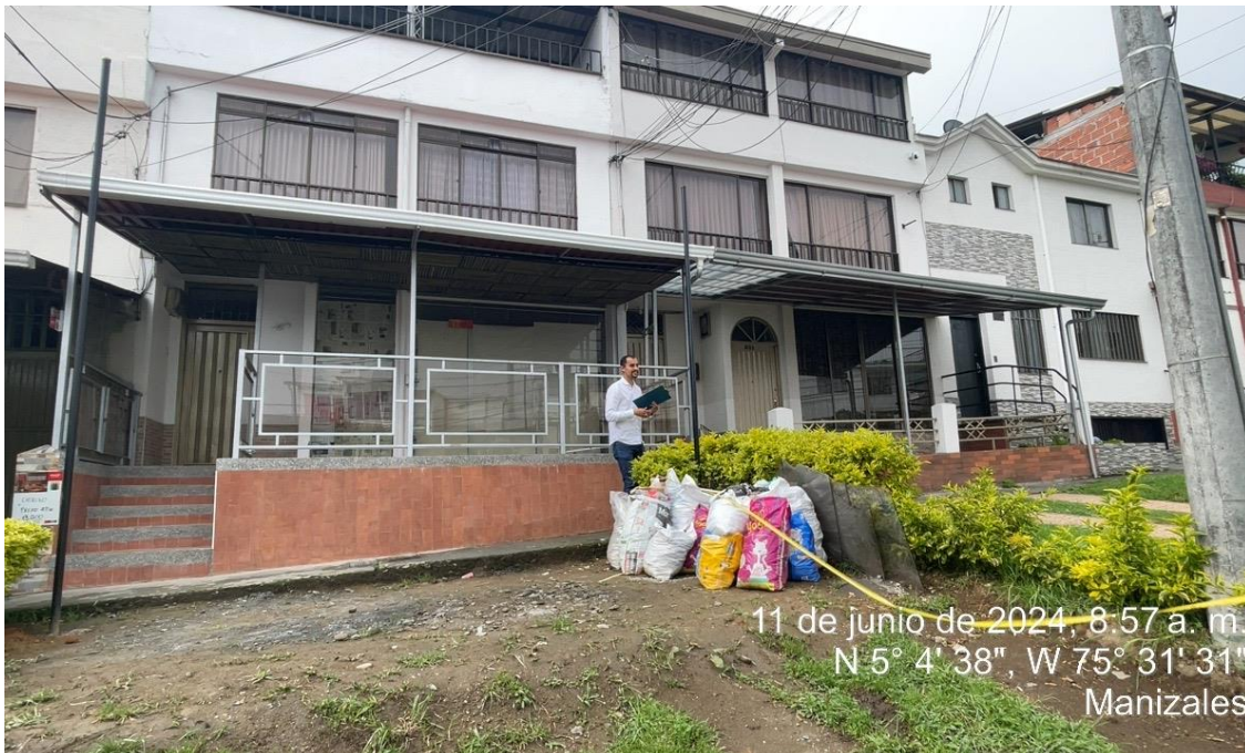
Imagen No. 6 – Evidencia fotográfica de instalación de perfilería metálica para adecuación de un toldo Calle 10 No. 08-15, barrio Chipre.