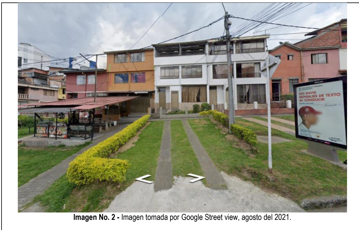
Imagen No. 2 - Imagen tomada por Google Street view, agosto del 2021.