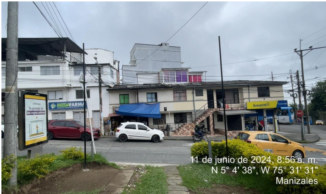
Imagen No. 5 – Evidencia fotográfica de instalación de perfilería metálica para adecuación de un toldo Calle 10 No. 08-15, barrio Chipre.