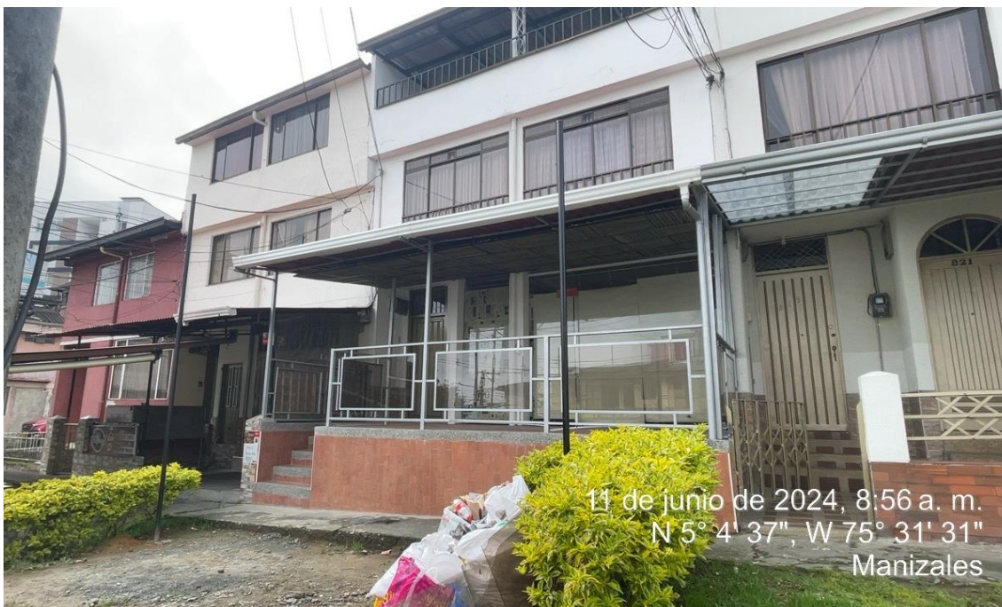
Imagen No. 3 – Evidencia fotográfica de cerramiento y cubierta en antejardín Calle 10 No. 08-15, barrio Chipre.