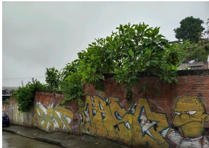
Imagen 1 y 2. Individuos a intervenir

De acuerdo a inspección ocular se evidencian: