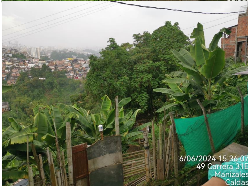
Imagen No. 3: Registro Fotográfico del 06 de Junio de 2024. Cerramiento en madera y lona. Cultivo de plátano.