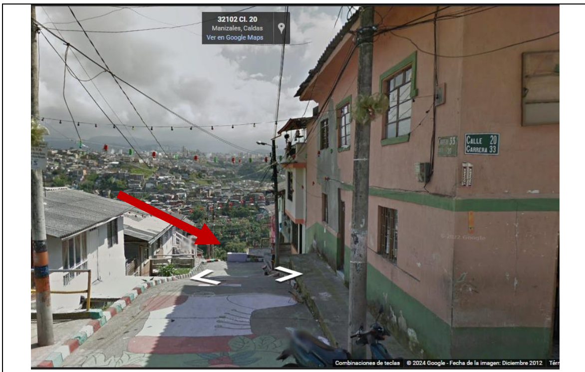
IMAGEN No 2. Imagen tomada por Google Street view, diciembre 2012.