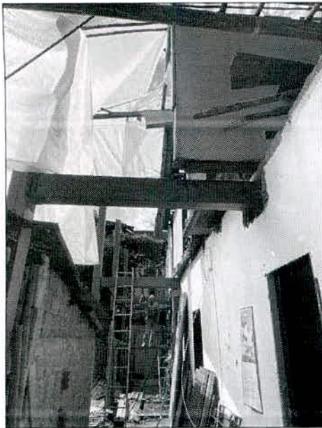
Foto 5. Estructura metálica.