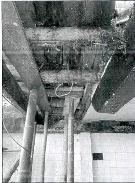
Foto 6. Entrepiso apuntalado.