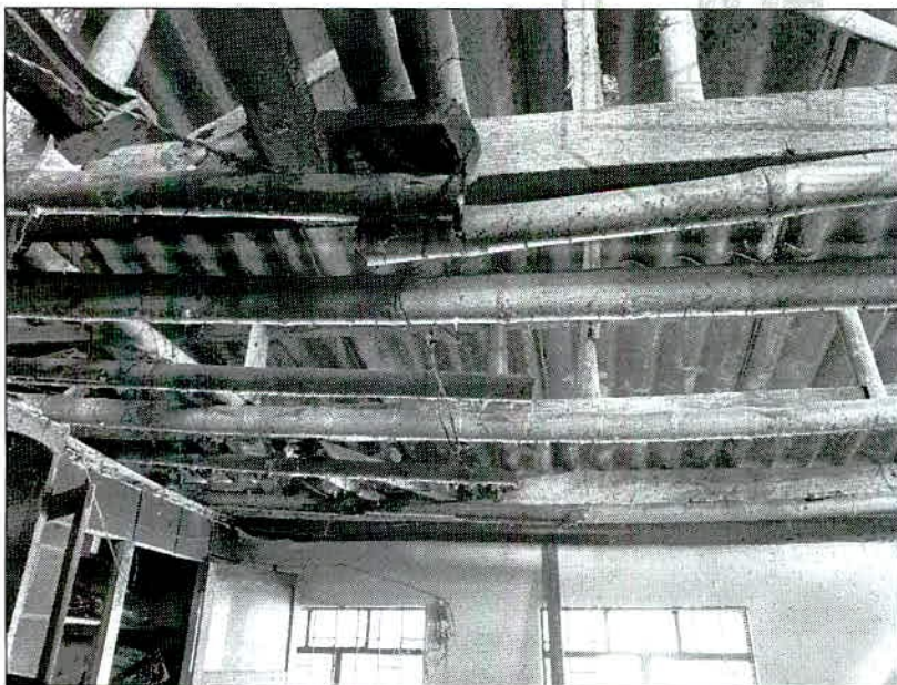
Foto 3. Estructura de guaduas en estado de deterioro.