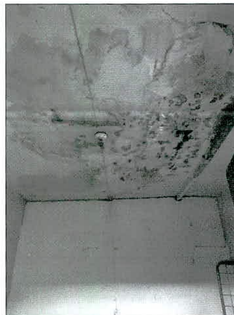
Foto 4. Humedad severa en cielo raso.