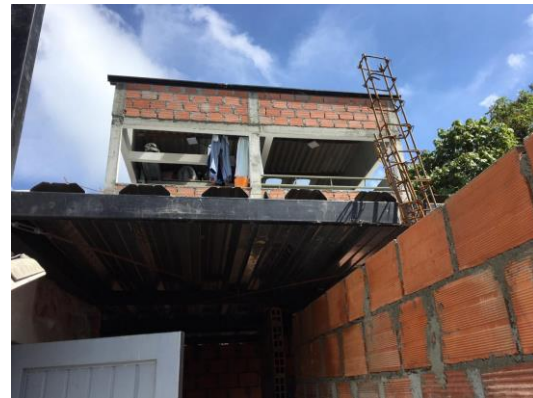
Fotografía No 6. Construcción de muros en la tercera planta en ladrillo farol.