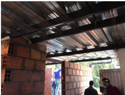
Fotografía No 5. Construcción de muros en la tercera planta en ladrillo farol.