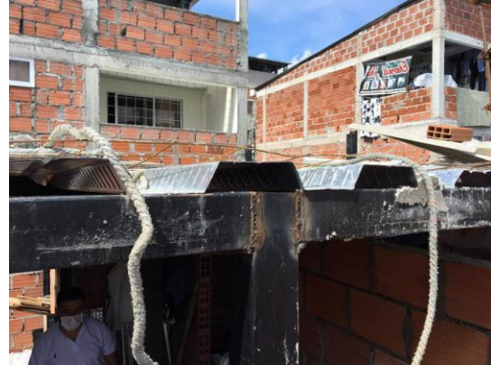
Fotografía No 4. Construcción de terraza sobre perfiles metálicos y Steel deck.