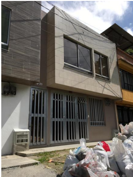
Fotografía No 1. Fachada de la vivienda con dirección Carrera 13 No. 46-29 y materiales de construcción sobre el antejardín.