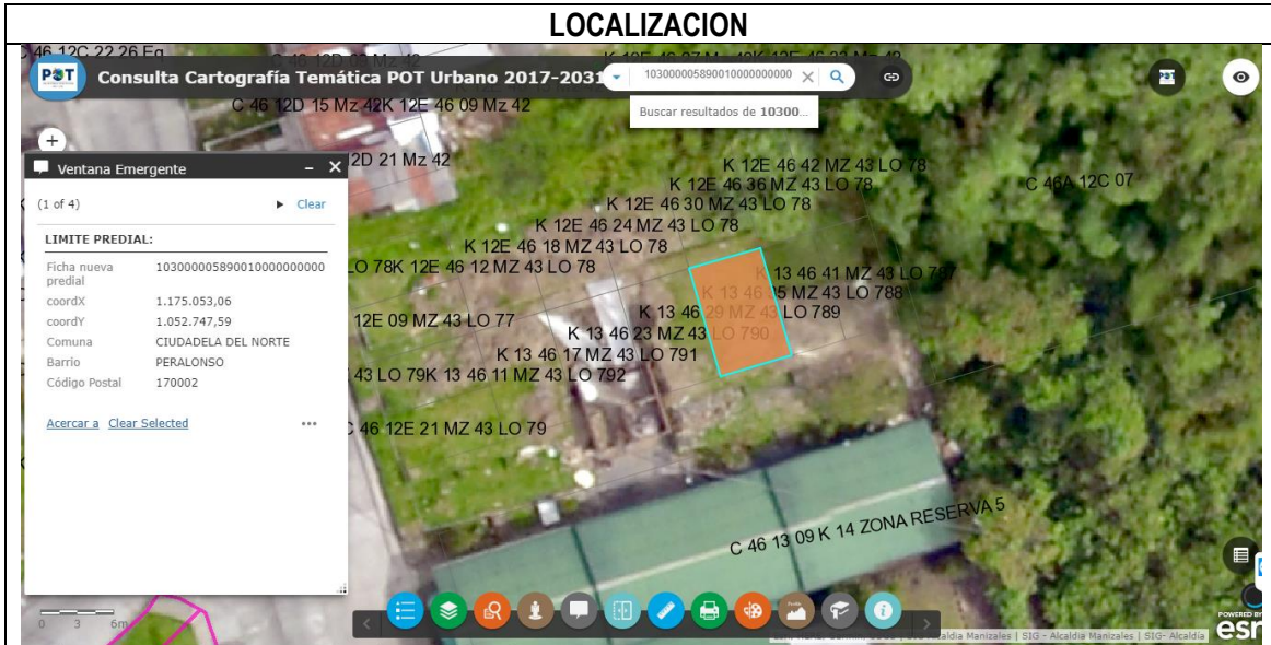
IMAGEN No1. Barrio Peralonso, Comuna Ciudadela Del Norte. Imagen cartográfica. Consulta Sistema Estructurante - Sistema de Información Geográfica – SIG.

SGM VC-0794-2020 Manizales, jueves, 24 de septiembre de 2020