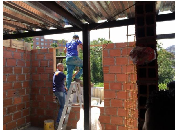
Fotografía No 2. Personal realizando labores constructivas sin los respectivos elementos de protección.