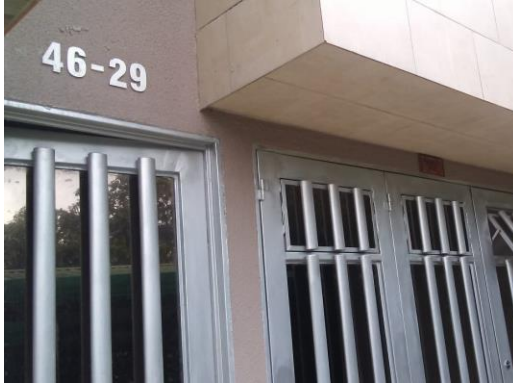
Fotografía No 3. Nomenclatura de la vivienda con dirección Carrera 13 No. 46-29

Manizales, jueves, 24 de septiembre de 2020