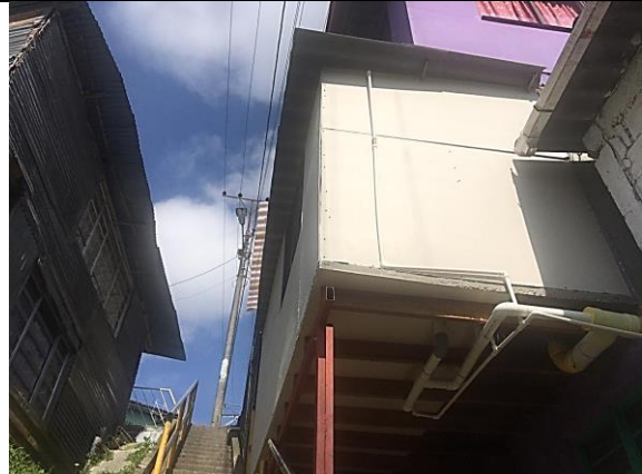
Foto No. 2 Se evidencia la culminación del cuarto de la vivienda