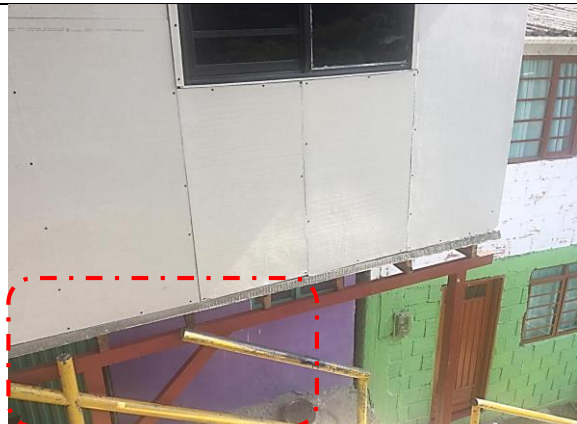
Foto No. 4 Se puede evidencia la invasión a las escaleras públicas y las modificaciones que le realizaron