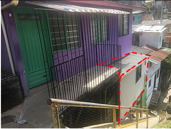
Foto No. 1 En la visita se evidencio el avance constructivo de un cuarto en estructura liviana sin ningún tipo de licencia