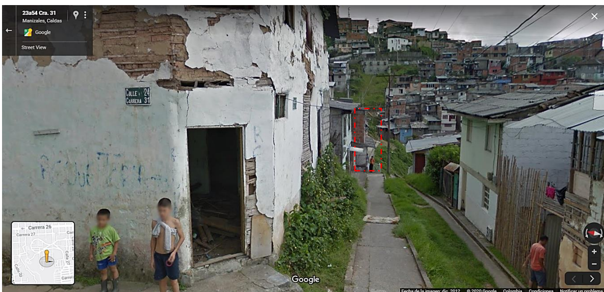
Imagen tomada por Google Street View, fachada de la vivienda diciembre 2012 Carrera 31 24-25