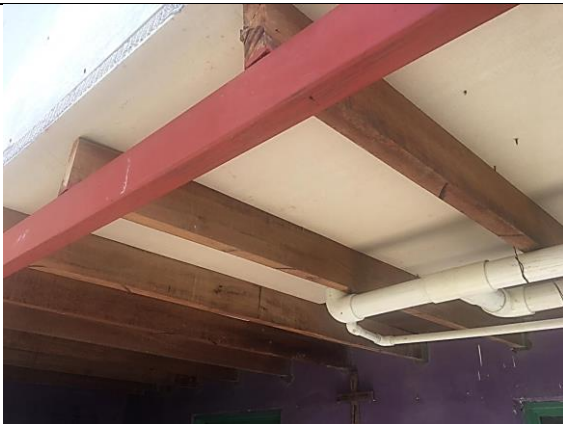
Foto No. 3 Se observa estructura metálica combinada con perfiles en madera, y adecuaciones hidráulicas