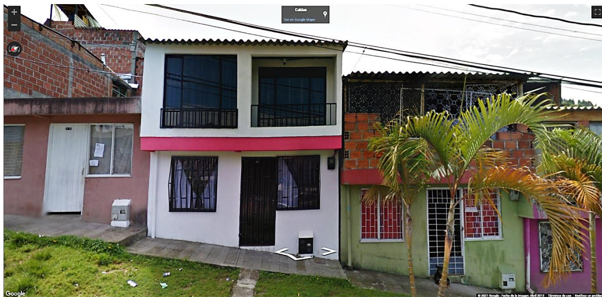
IMAGEN No2. Imagen tomada por Google Street View, abril de 2013.