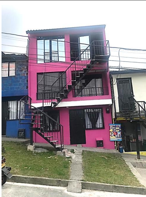
Foto No. 1 Fachada principal de la vivienda.