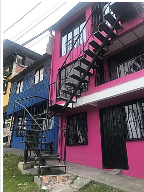
Foto No. 2 Detalle de localización de la escala sobre el Bien de Uso Público