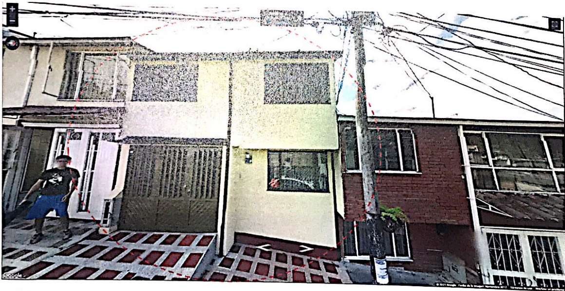
Imagen tomada por Google Street View, septiembre de 2013