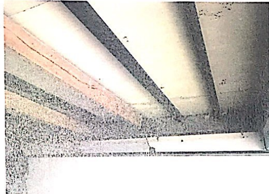
Foto No. 2 Losa de entpiso en superboard y periferia metálica.