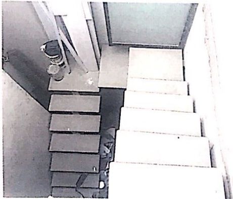
Foto No. 3 Escalera de acceso al tercer nivel