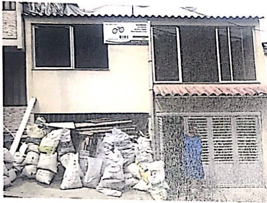
Foto No. 1 Fachada del inmueble. Se observan escombros y material de construcción sobre el espacio público