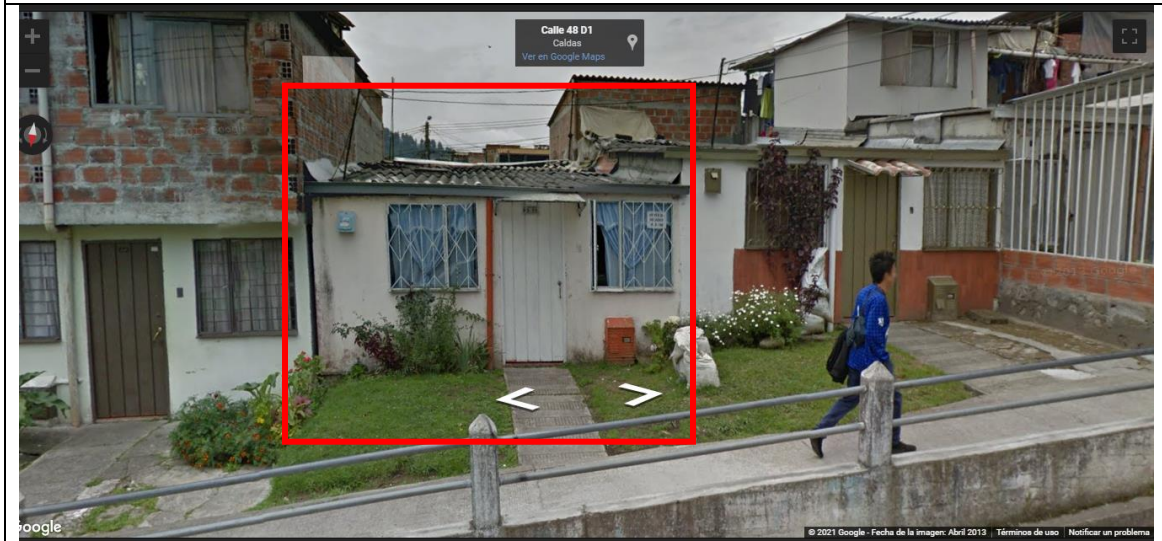
IMAGEN No 2. Imagen tomada por Google Street view, ABRIL 2013, Dirección Calle 48 D1 # 3 - 53