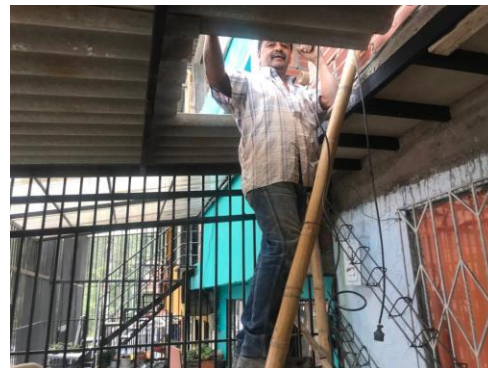
Fotografía No 6. Personal trabajando sin los respectivos elementos de protección.