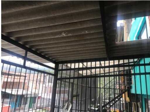
Fotografía No 3. Cerramiento metálico y cubierta sobre el antejardín.

Manizales, viernes, 19 de febrero de 2021