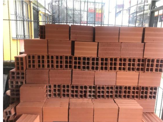
Fotografía No 4. Materiales de construcción en el inmueble.