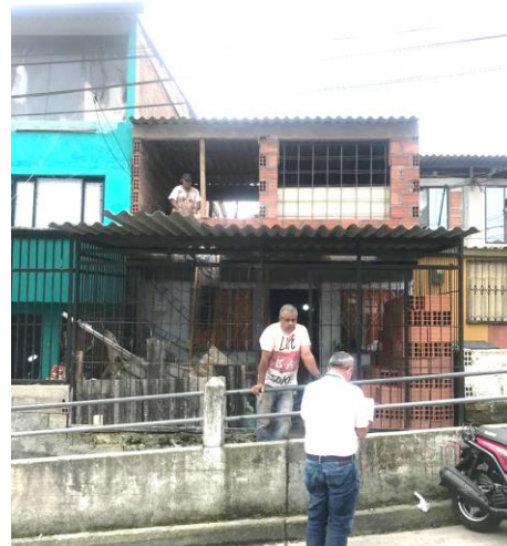
Fotografía No 2. Fachada de la vivienda con dirección Calle 48 D1 # 3 - 53, construcción de la segunda planta.