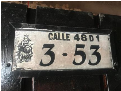
Fotografía No 1. Nomenclatura