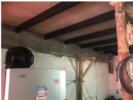
Fotografía No 5. Losa de entrepiso en perfilaría metálica y placas de fibrocemento.