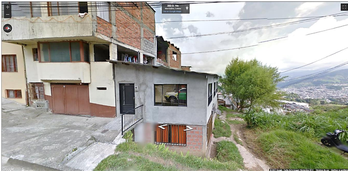
Imagen tomada por Google Street View, noviembre de 2012