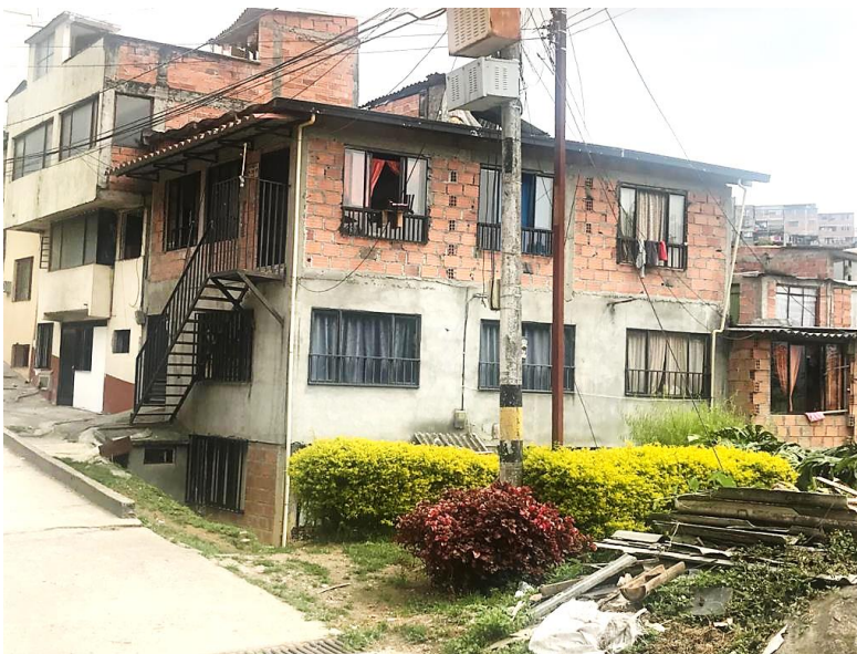
Foto No. 1 Fachadas principales del inmueble. Al momento de la visita no se observa obra constructiva en curso