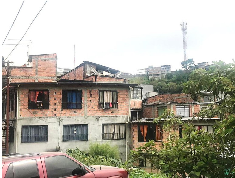
Foto No. 2 Fachada lateral