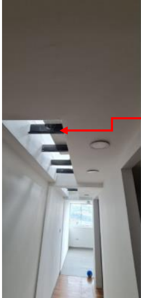
Fotografía No 5.

Apertura de losa de entre piso nueva en concreto, para la iluminación y ventilación de nuevos espacios.