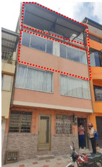
Fotografía No 1.

Fachada principal del predio, donde se puede evidenciar el crecimiento de la vivienda en un tercer y cuarto piso, donde la materialidad y acabados exteriores de la misma, evidencian las obras que se encuentran ejecutando.