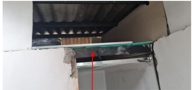
Fotografía No 8.

Reforzamiento estructural con perfilera metálica, el cual se evidencio en el último piso construido de la vivienda.