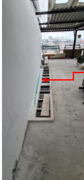
Fotografía No 6.

Otra perspectiva de la apertura de losa de entre piso nueva en concreto, para la iluminación y ventilación de nuevos espacios.