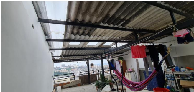
Fotografía No 7.

Imagen general de la terraza nueva construida en la propiedad, donde se evidenció una cubierta en estructura metálica negra con tejas en fibro cemento.