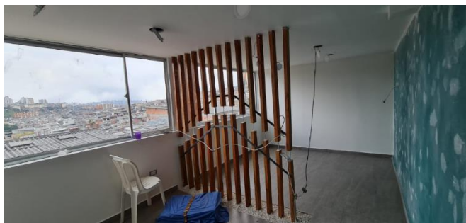
Fotografía No 3.

Otro ambiente o habitación de la vivienda en proceso constructivo y de cambio en distribución arquitectónica.