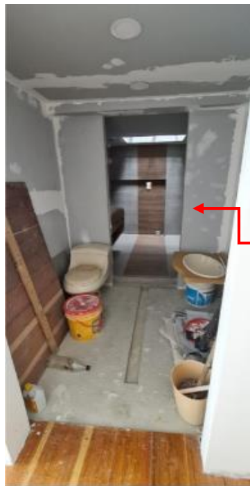
Fotografía No 2.

Vista de trabajos internos en baño de la propiedad, donde se evidenciaron muros y divisiones en sistema liviano nuevas en proceso de estuco y pintura.