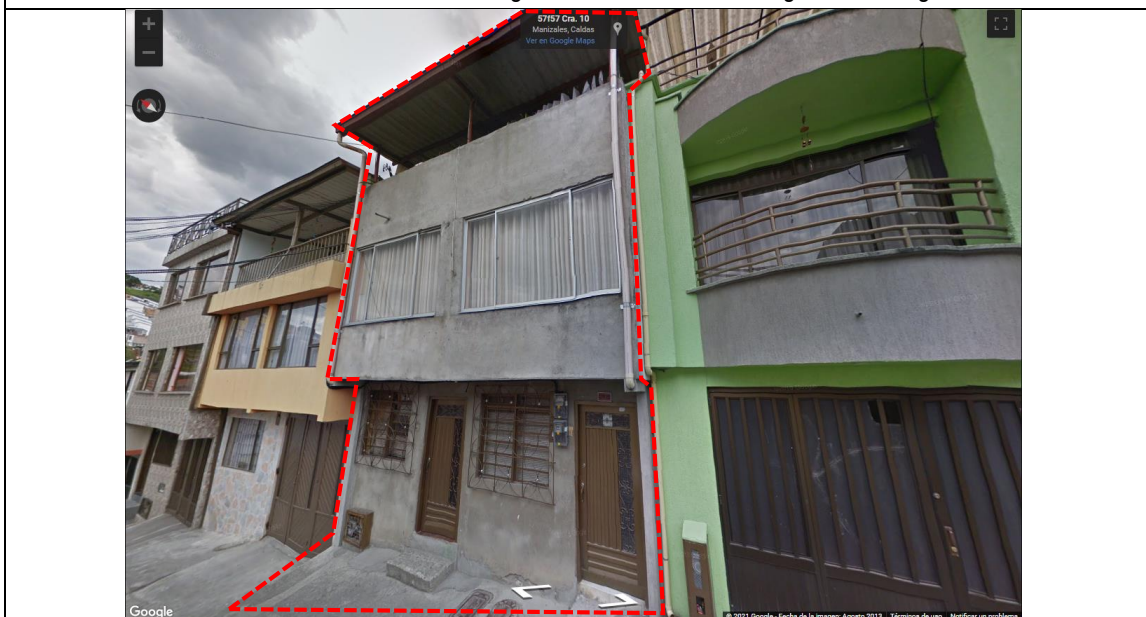
IMAGEN No 2. Imagen tomada por Google Street View, Diciembre de 2012, Dirección Carrera 10 # 57F-25, La Carolita.