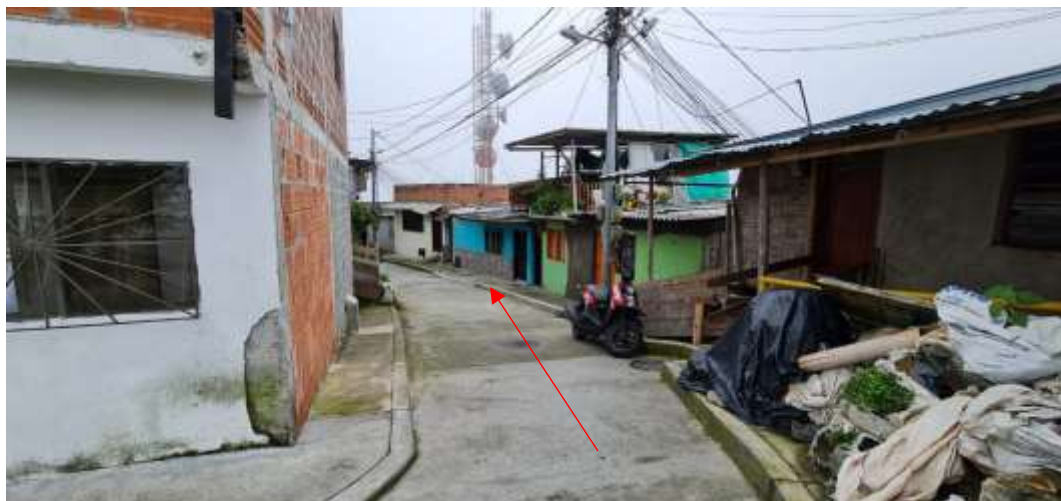
Fotografía No 1. Ingreso propiedad del señor FERNEY TREJOS con dirección Calle 9A casa 14 00.

REGISTRO FOTOGRAFICO de la visita ocular realizada el día 15 de marzo del 2021 por parte del Equipo Técnico de Vigilancia y Control Urbanístico.