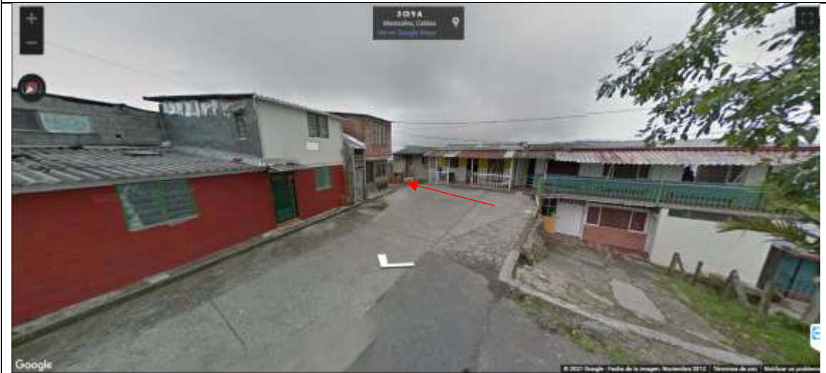
IMAGEN No 2. Imagen tomada por Google Street view, Noviembre 2012, ingreso a la dirección Calle 9A casa 14 00