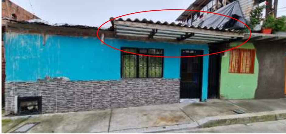
Fotografía No 2. Ampliación de la vivienda con una losa de entrepiso en Steeldeck y vigas de concreto.