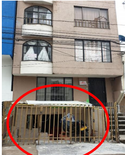
Foto No. 1 Fachada principal del edificio con dirección Carrera 11 # 9-43, Edif. Nariño. Se observan el cerramiento en reja metálica cubierto invadiendo el antejardín el antejardín.