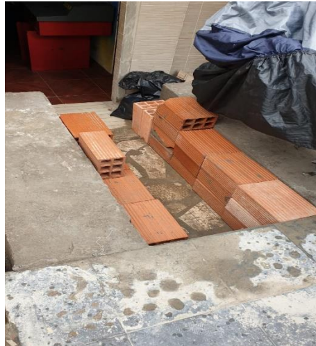
Foto No 2. Detalle de la construcción de la rampa, invadiendo el antejardín.