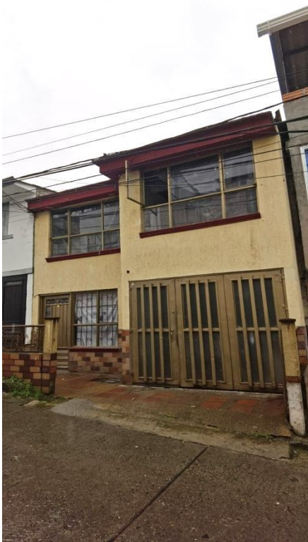
Foto No. 1 Fachada del predio intervenido.