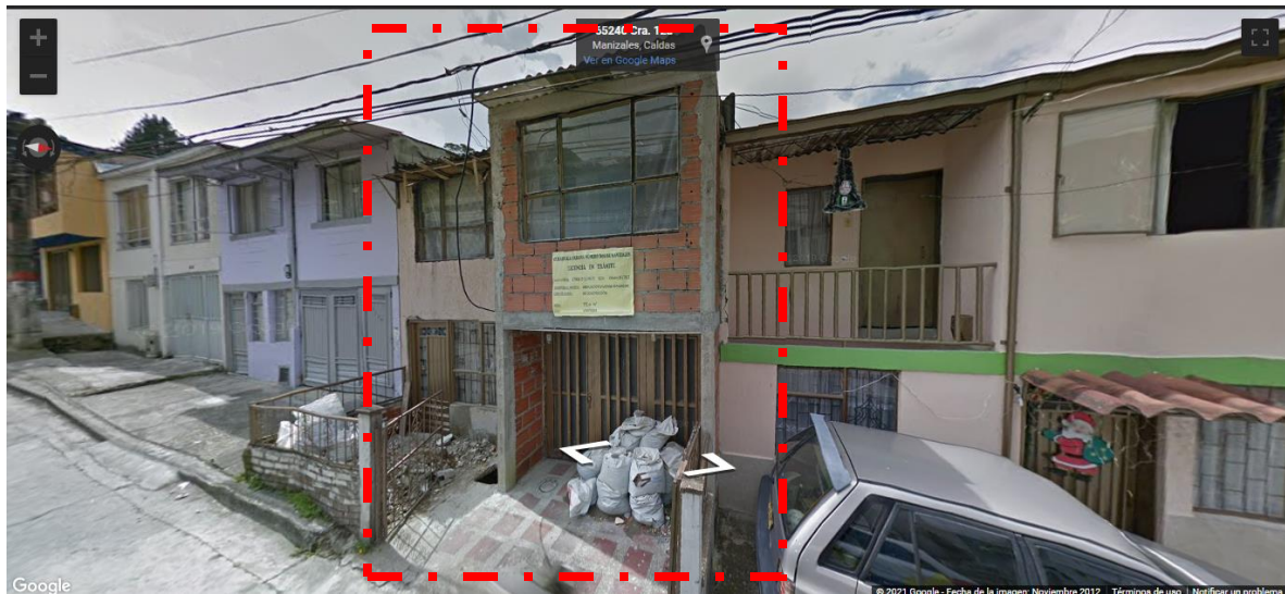
Vista fachada principal, de vivienda preexistente en predio en cuestión, Carrera 12A # 65-122 – Imagen tomada en noviembre de 2012, por Google Street View..