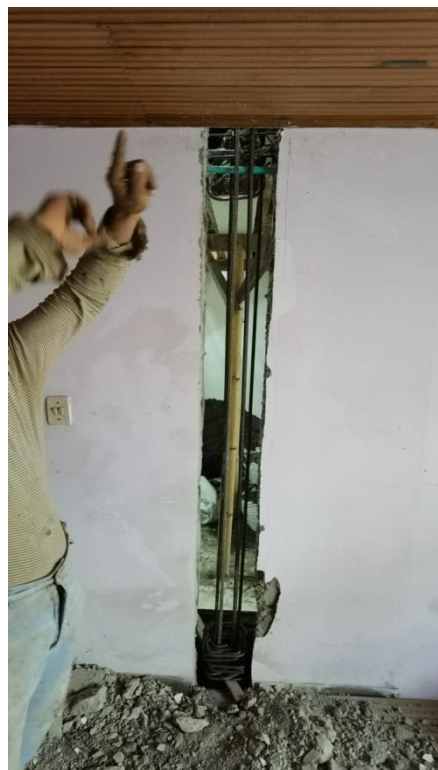
Foto No. 2. Detalle de la demolición de la pared existente para construir columnetas que servirán de refuerzo estructural a la futura losa de entrepiso.