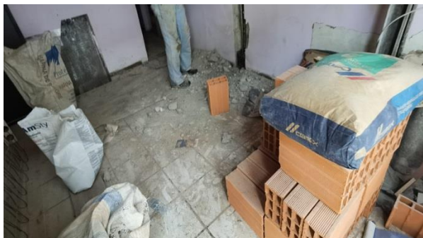
Foto No. 3. Detalle de materiales de construcción dentro de la vivienda