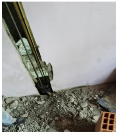
Foto No. 4. Detalle de la demolición de la pared existente para construir columnetas que servirán de refuerzo estructural a la futura losa de entrepiso.