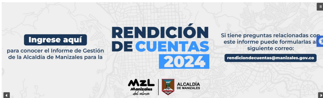
Imagen de la pieza publicitaria implementada para convocar a la rendición de cuentas

También se realizó una campaña de expectativa y una consulta ciudadana con respecto a los temas en los que se tiene mayor interés. En el correo electrónico referenciado, no se recibió ninguna solicitud, observación o sugerencia.