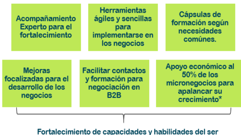
Tabla 3. Beneficios del programa MicroNegocios Manizales versión 1.0 - 2022.