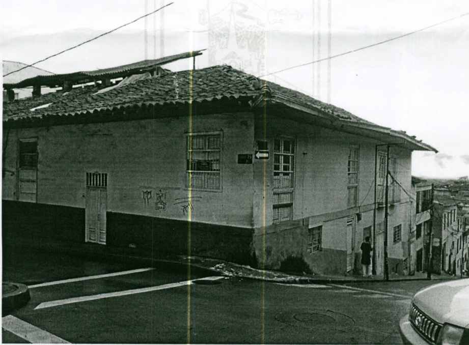
Imagen 1. Vivienda localizada en la calle 20 con carrera 25 esquina.

En relación al asunto de referencia, se destinó personal de la Unidad de Gestión del Riesgo para que realizara una inspección visual en la vivienda localizada en la calle 20 con carrera 25 esquina, de la cual se derivan las siguientes observaciones: