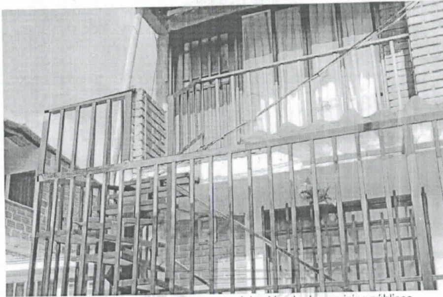
Foto No3. Escaleras sobre el trayecto del cableado de servicios públicos.