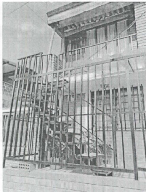
Foto No2. Escaleras construidas sobre zona verde.