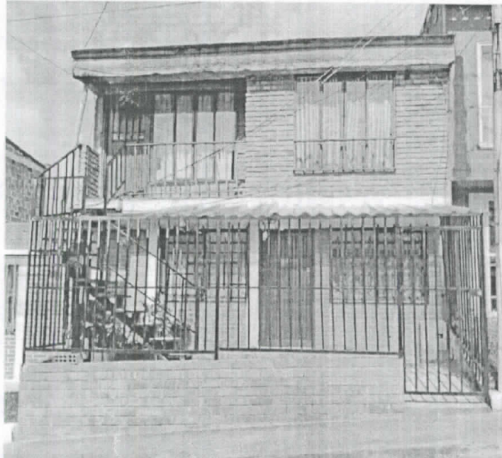
Foto No1. Fachada del inmueble ubicado en la Carrera 33 No. 49D-26