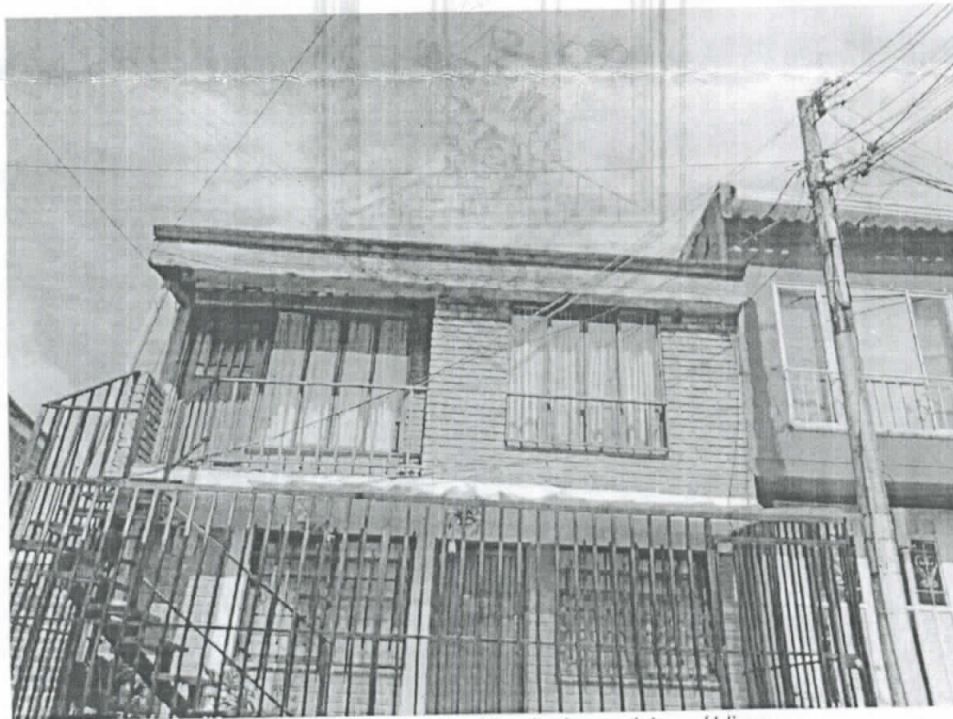
Foto No3. Trayecto del cableado de servicios públicos

USO OFICIAL - ALCALDÍA DE MANIZALES USO OFICIAL - ALCALDÍA DE MANIZALES