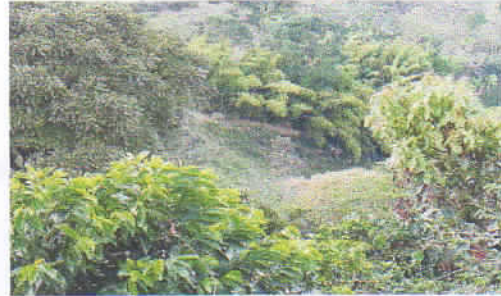
Fotografía 2. Área de descole de las aguas residuales domesticas