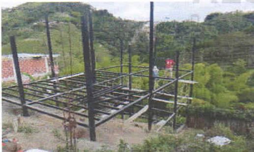
Fotografía 3. Viviendas nuevas localizadas en el área visitada