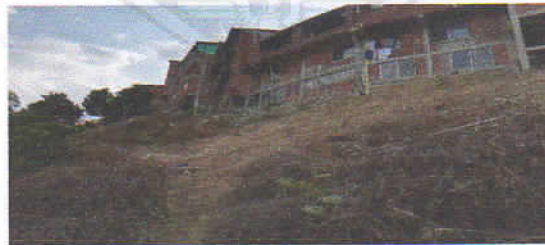
Fotografía 5. Tala de soca de café.