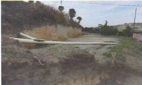
Fotografía 1. Sistema de conducción de aguas residuales empleado actualmente

SMA-UGA 0088-19 Manizales, Enero 28 de 2019