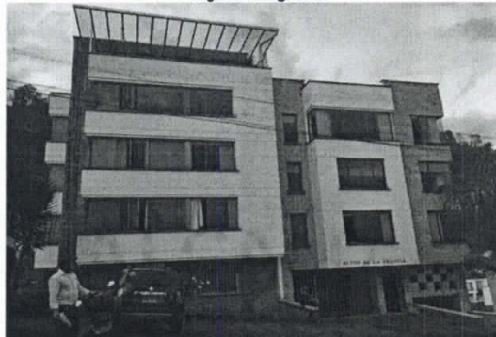
Fotografía 1. Antes

FECHA SEGUNDA VISITA Día : 19 Mes 12 Año 2018