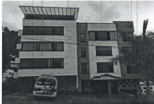
Fotografía 2. Despues