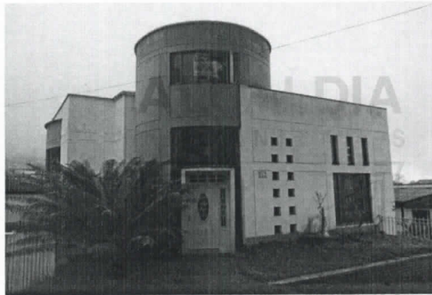
Fotografía 1. Frontal