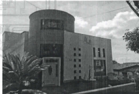
Fotografía 2 y 3. Lateral y Frontal