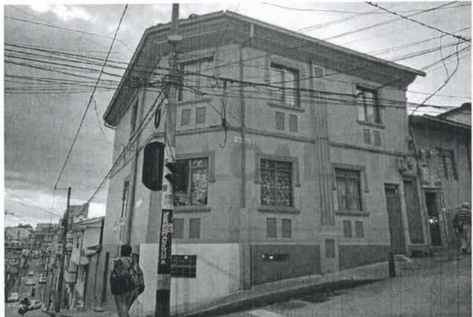
Fotografia 1. Frontal

FECHA SEGUNDA VISITA Día 27 Mes 12 Año 2018