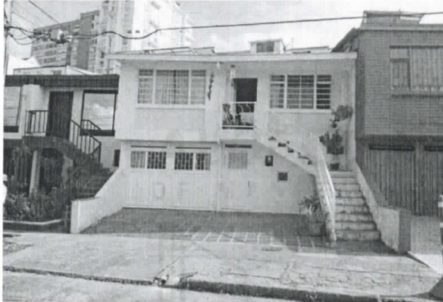
Fotografía 1. Frontal