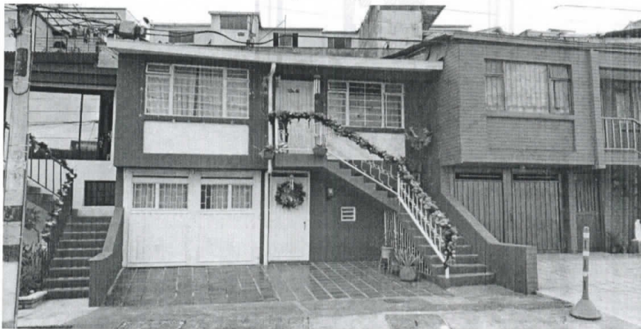
Fotografía 1. Frontal