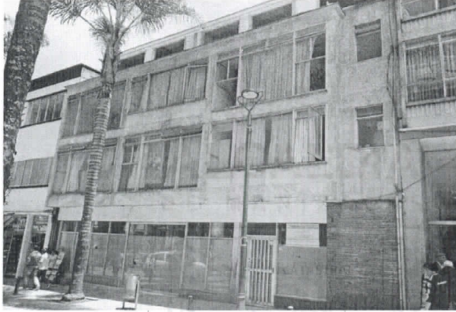
Fotografía 1. Frontal