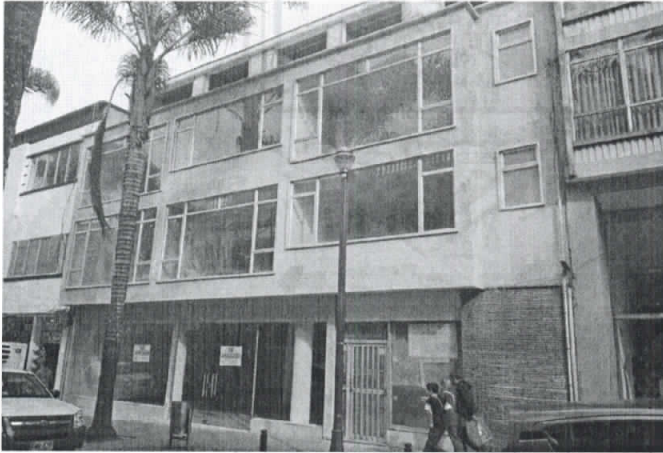
Fotografía 1. Frontal