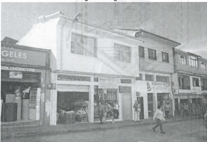
Fotografía 1. Frontal