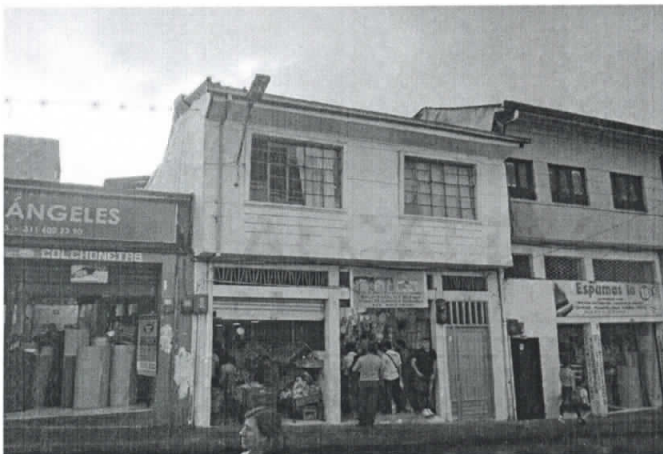
Fotografía 1. Frontal