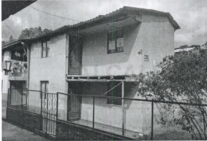
Fotografía 1. Frontal