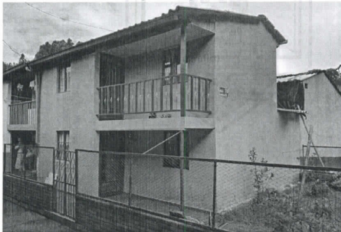
Fotografía 1. Frontal