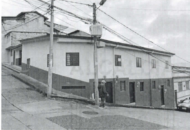
Fotografía 1. Frontal