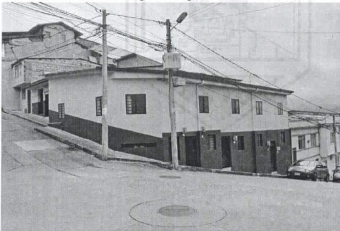
Fotografía 1. Frontal