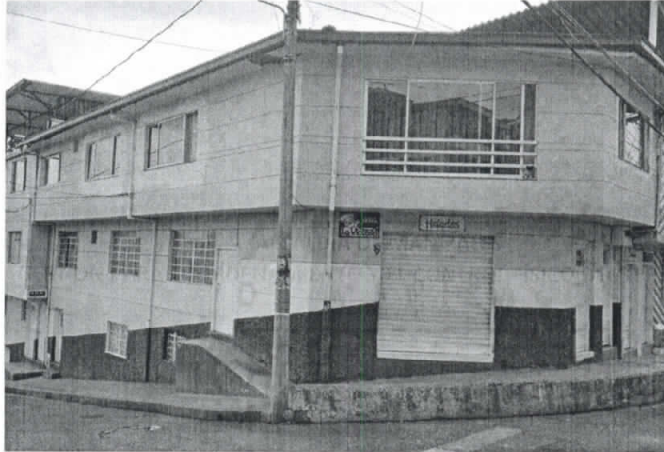
Fotografía 1. Frontal