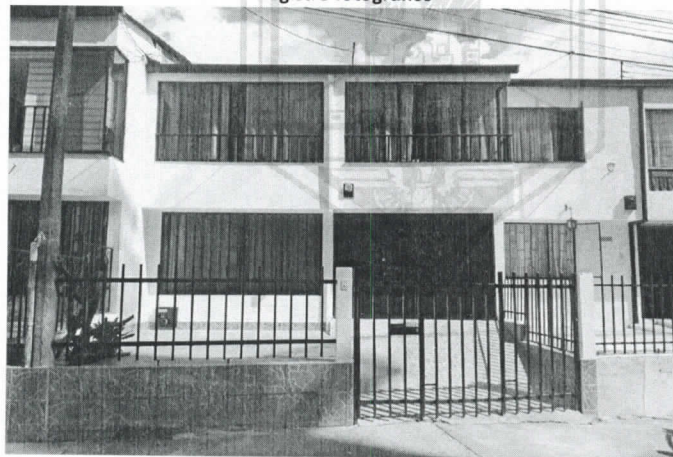
Fotografia 1. Frontal