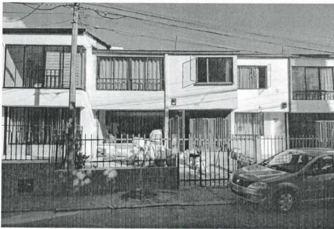
Fotografia 1. Frontal