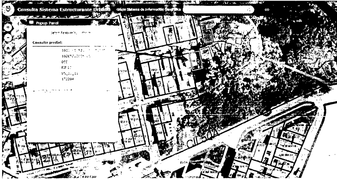
Imagen 2. Localización del predio mediante consulta IGAC – Sistema Estructurante Urbano.