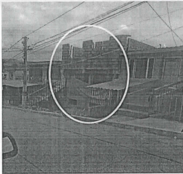
Foto No.1 – Fachada de la vivienda, construcción de vivienda de tres niveles.