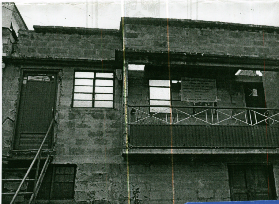
Imagen 1. Vista frontal del inmueble

Por solicitud de Secretaría de Planeación , se destinó personal de la Unidad de Gestión del Riesgo, para que realizara una inspección visual en la vivienda localizada en la calle 61 N° 10-69 en el Barrio Minitas, con el fin de valorar el nivel de riesgo que puede presentar la vivienda con relación a los demás inmuebles, de la cual se derivan las siguientes observaciones: