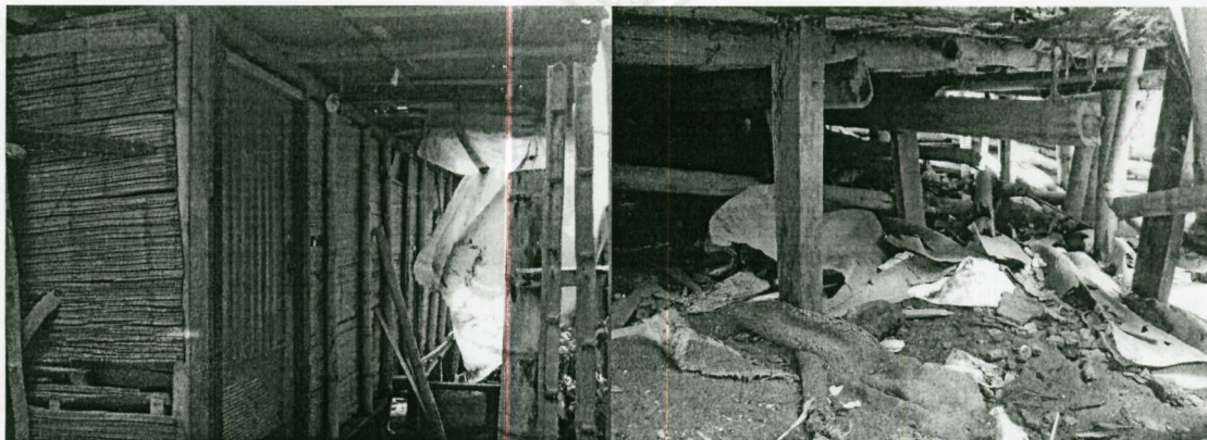
Imagen 1 y 2. Deterioro en la madera.

Cabe aclarar que la vivienda se encontraba deshabitada en el momento de la inspección y no se pudo realizar una valoración en su interior.