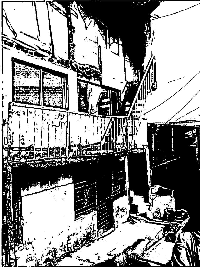
Imagen 2. Vista frontal de la vivienda.