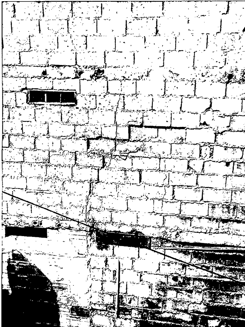
Imagen 1. Vista lateral de la vivienda. Grietas verticales y exposición de la madera de entre piso.