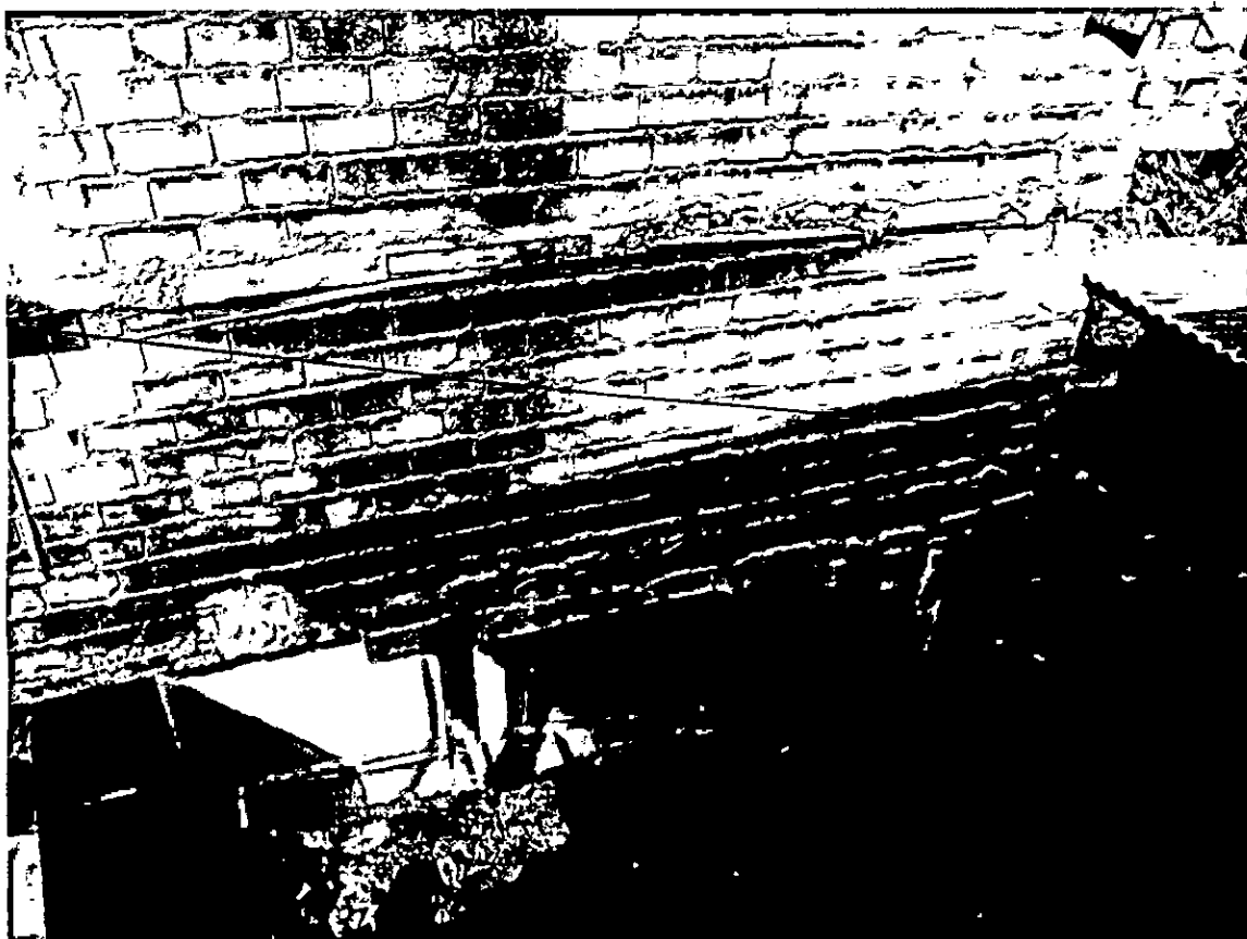
Imagen 3. Mampostería confinada con vigas. Ausencia de columnas en los niveles superiores.