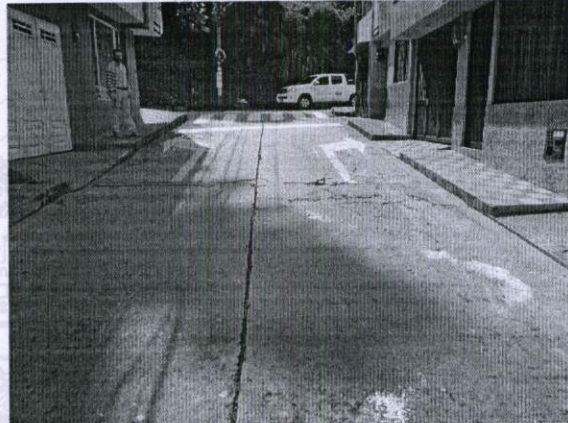
Área de pavimento afectado: 30M2 aproximadamente