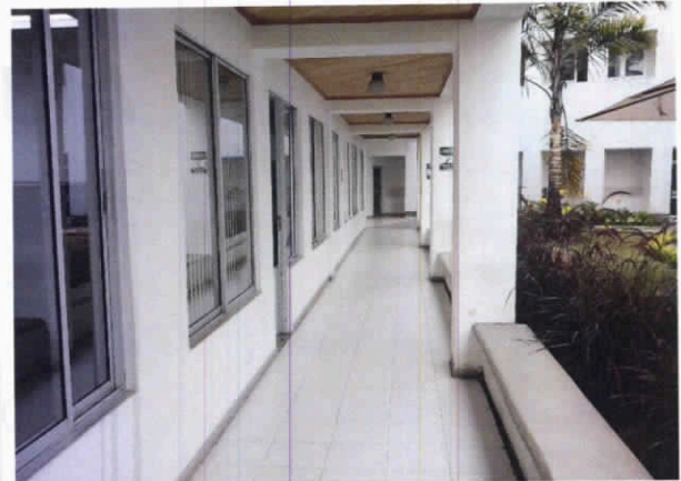
Fotografía 6. Puertas en vidrio y lamina de aluminio