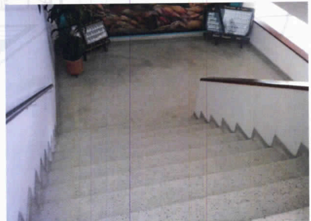
Fotografía 8. Escalas