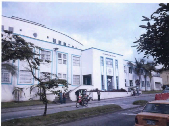
Fotografía 1. Fachada