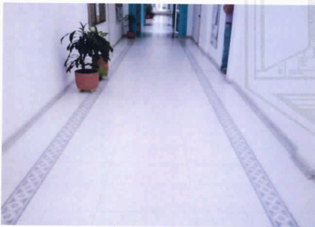
Fotografía 9. Pasillo