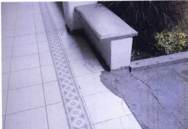
Fotografía 5. Baldosas deterioradas