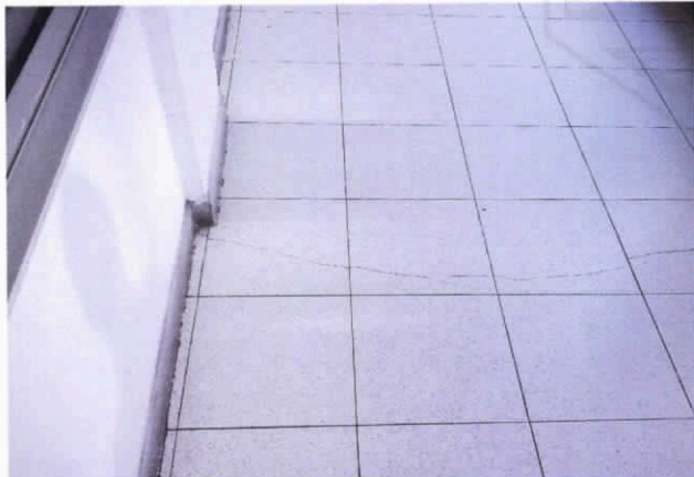
Fotografía 7. Fisuras en baldosas