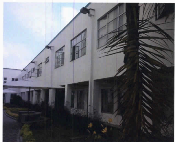
Fotografía 2. Interior