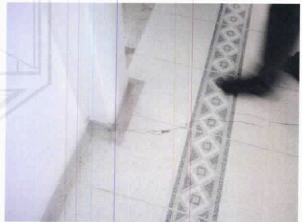
Fotografía 10. Fisuras en baldosa