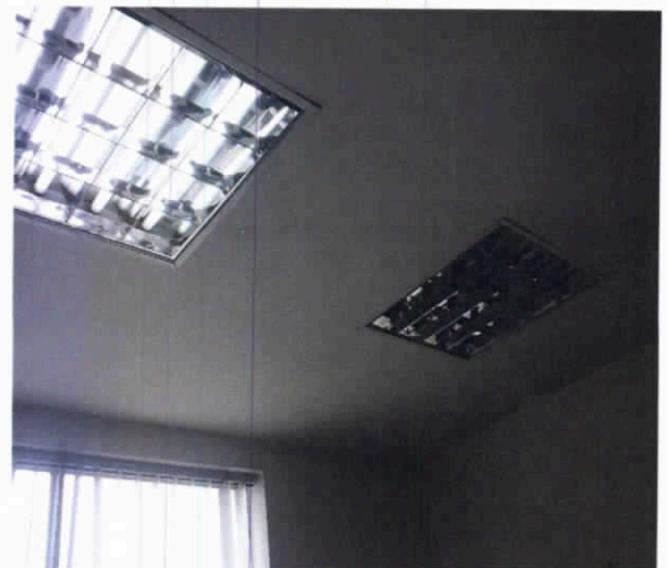
Fotografía 12. Cielo raso