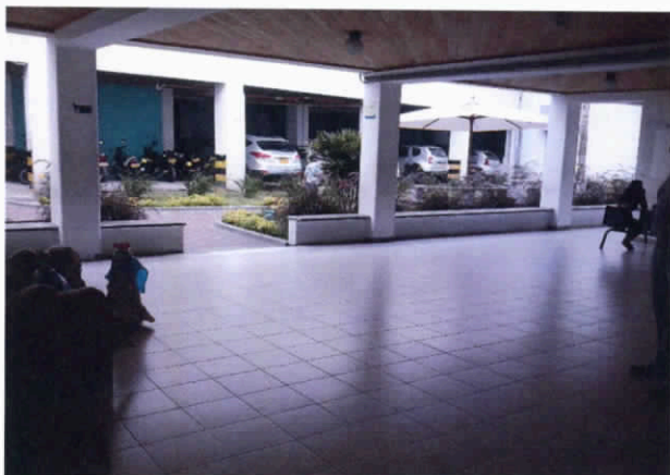
Fotografía 3. Cielo raso en madera