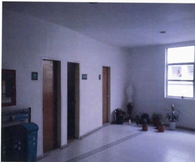
Fotografía 11. Baños