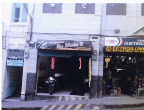
Fotografía 1. Fachada local 101