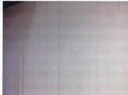
Fotografía 3. Fisuras sobre muros interiores