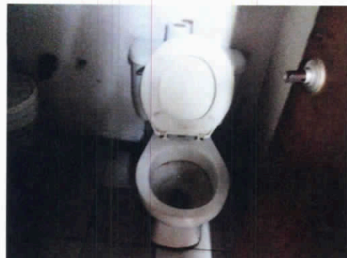
Fotografía 8. Unidad sanitaria