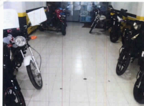
Fotografía 6. Piso en buen estado