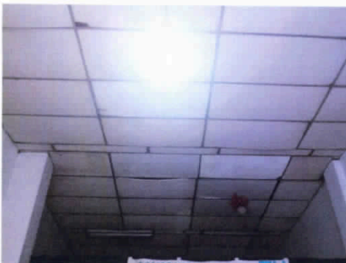
Fotografía 7. Cielo raso en buen estado