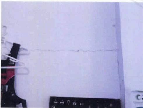
Fotografía 4. Fisuras sobre muros interiores