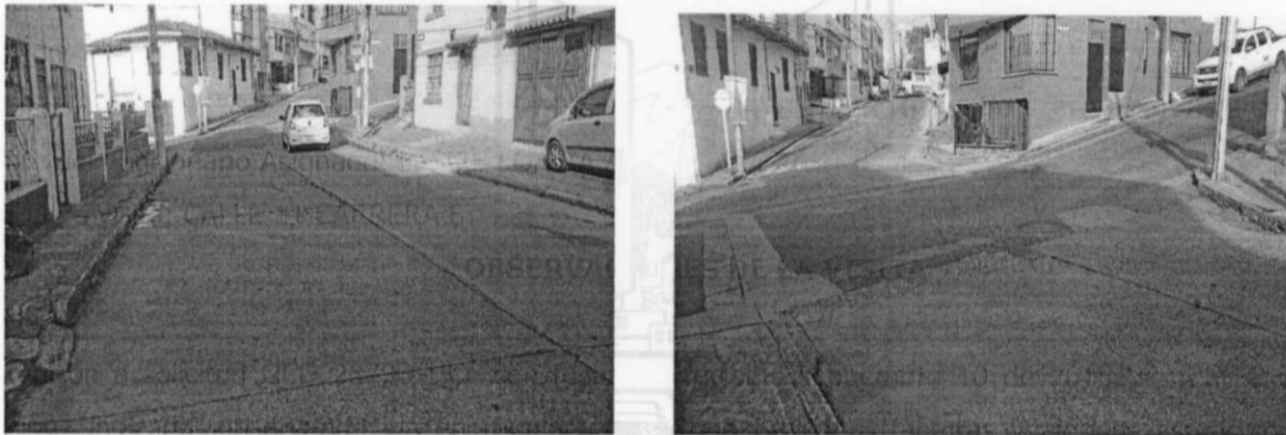
Área de pavimento afectado: 80 m2 aproximadamente