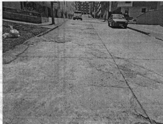
Área de pavimento afectado: 350 M2 aproximadamente